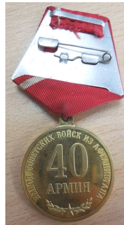
Медаль «20 лет вывода советских войск из Афганистана»