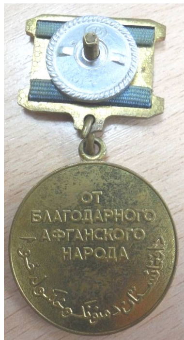
Медаль «От благодарного афганского народа»