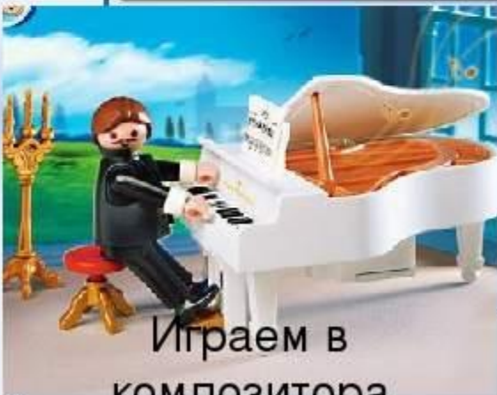
Играем в композитора