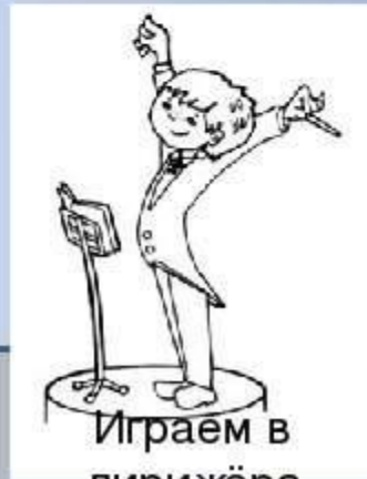
Играем в дирижёра