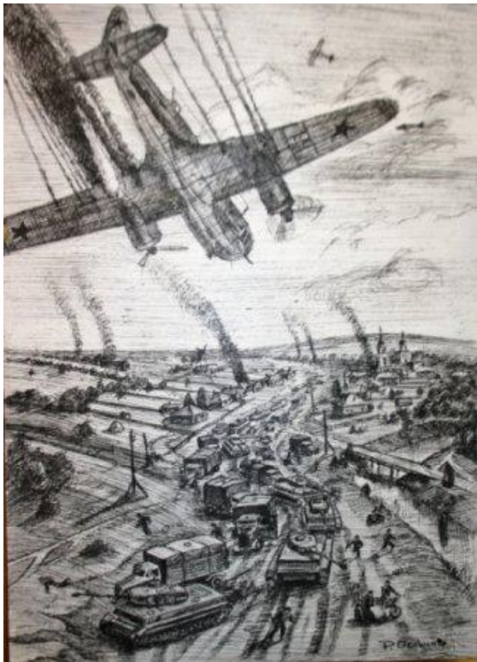
Бессмертный подвиг Героя Советского Союза капитана Н. Ф. Гастелло