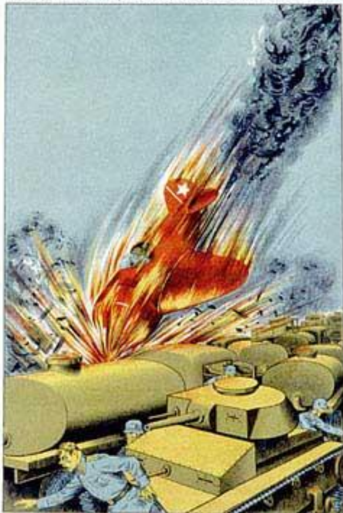
Слетая в одиночку прямо в цель в Ленинградском небе Герой Советского Союза капитан Н. Ф. Гастелло. Восторженные радостные крики слышны на улицах Ленинграда, затрясавшем в тот злополучный день. Звезда не гаснет никогда в сознании народа.