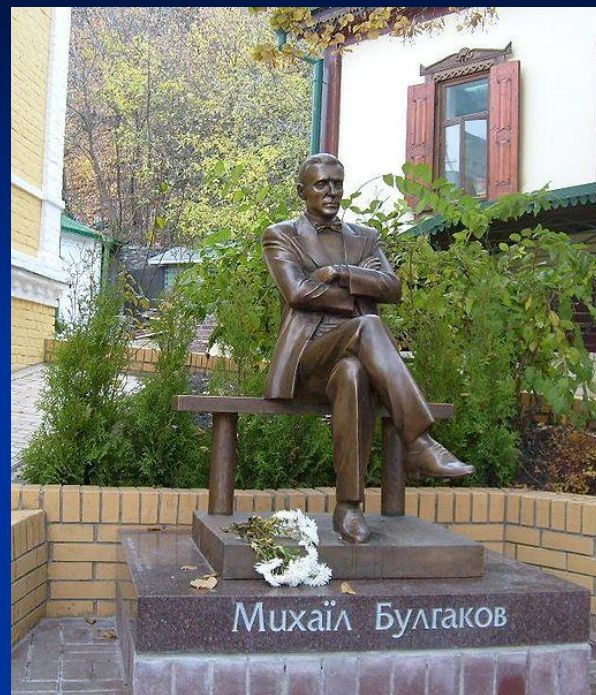
Открытый в октябре 2007 года памятник Булгакову возле его дома-музея в Киеве