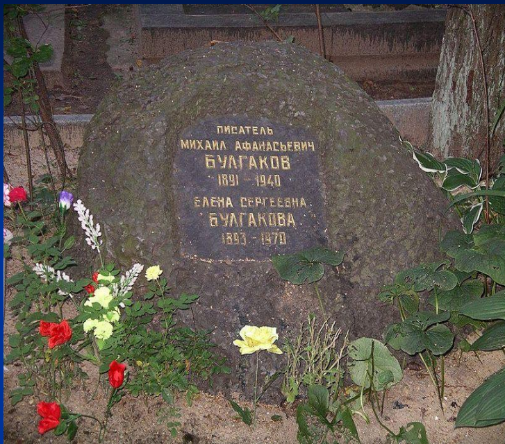
Камень с могилы Гоголя на могиле Булгакова