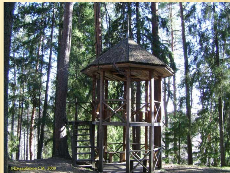
Двухъярусная беседка Считается, что здесь Островскому А.Н. пришла в голову идея создания пьесы "Снегурочка".