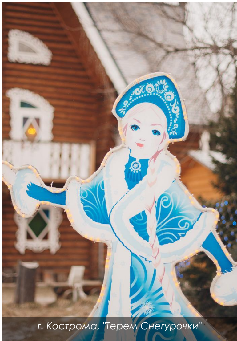
г. Кострома, "Терем Снегурочки"

Кострому всегда играла юная девушка в белом наряде (традиционный цвет Снегурочки), иногда обряды принимали форму похорон. Интересно, что в одном из вариантов сказки Снегурочка погибает, прыгая через костер — Кострому иногда представляют в виде соломенной куклы, сжигаемой в конце весны на костре.