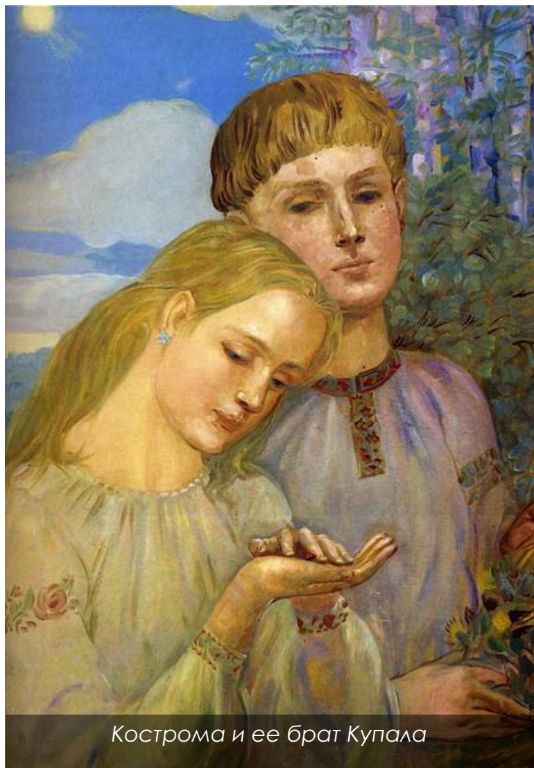
Кострома и ее брат Купала