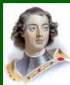
Петр I 1682-1725 5

Период в истории России с 1725 по 1762 гг.