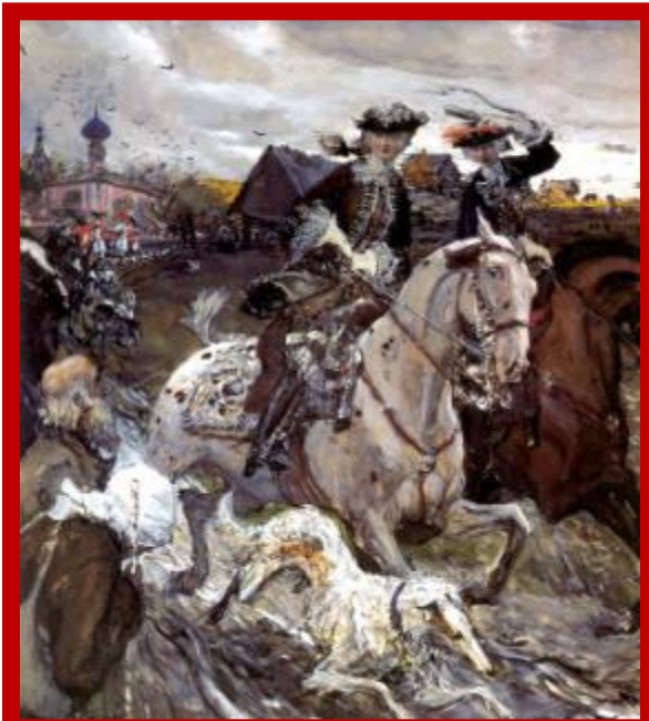
Валентин Серов. Петр II и цесаревна Елизавета на псовой охоте.

Участия в управлении государственными делами не принимал, фактически страной управлял Верховный тайный совет. Открыто выражал пренебрежение к реформам Петра I. Перенёс столицу из Санкт-Петербурга в Москву.