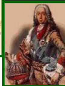
Петр III 1761-1762 2