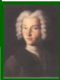
Петр II 1727-1730 0