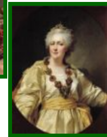
Екатерина II 1762-1796