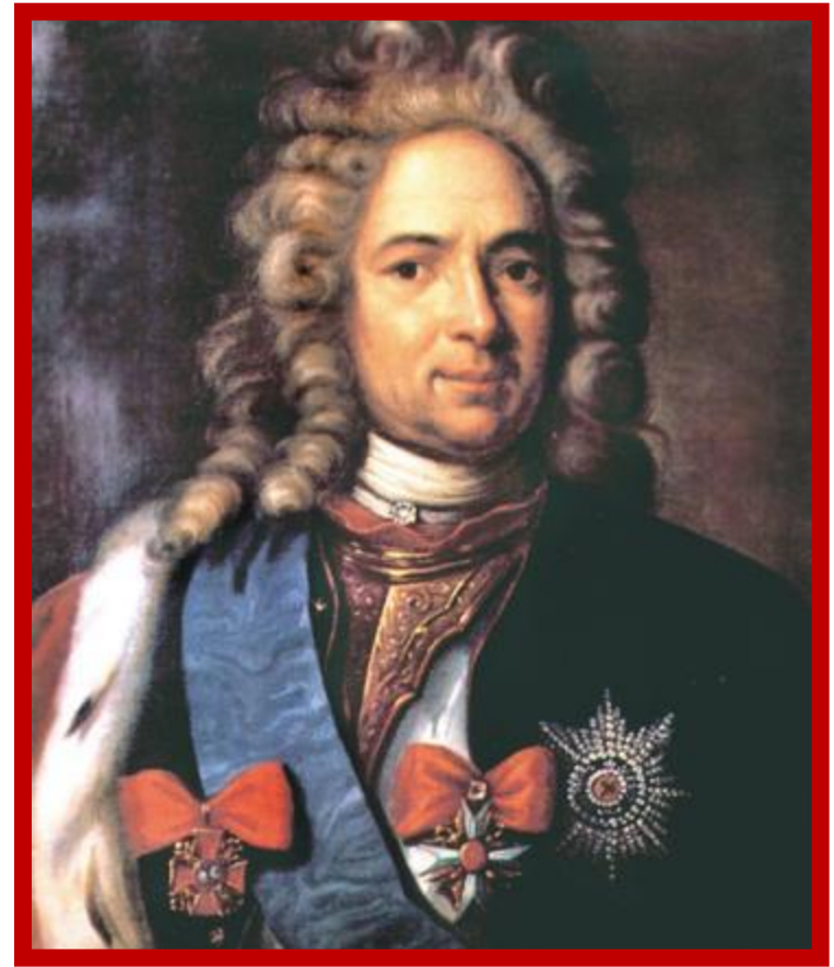
А. Д. Меншиков