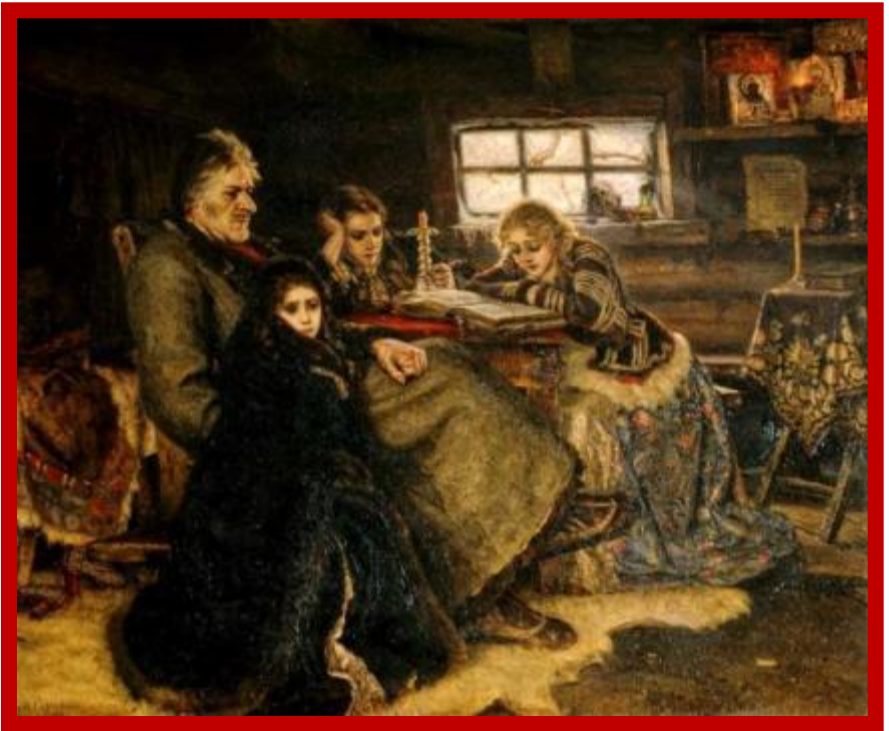
Суриков В.И. Меньшиков в Березове.