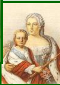
Иван VI Антонович и Анна Леопольдовна 1740-1741