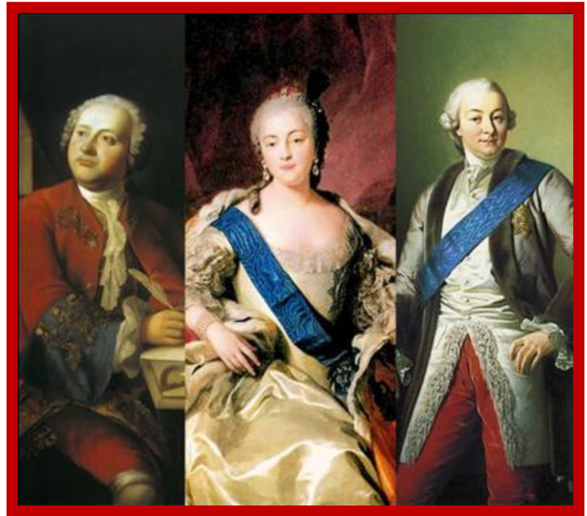
М.В. Ломоносов, Елизавета Петровна, И.И. Шувалов.