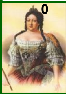
Анна Иоаннов на 1730-1740 0