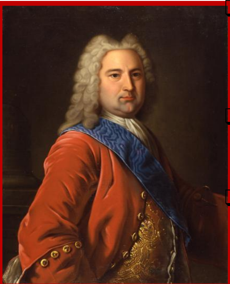
Эрнст Бирон – фаворит Анны Иоанновны

□ Анна Иоанновна вступила на престол по приглашению Верховного тайного совета на условиях «Кондиций».