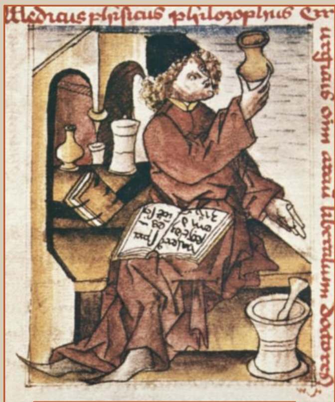
Средневековый врач с уринарием в руках

Чаще средневековые врачи использовали в качестве эмблемы изображение уринария (сосуда для мочи). Исследование мочи на глаз — так называемая уроскопия — являлось одним из древнейших способов диагностики в медицине всех народов мира.