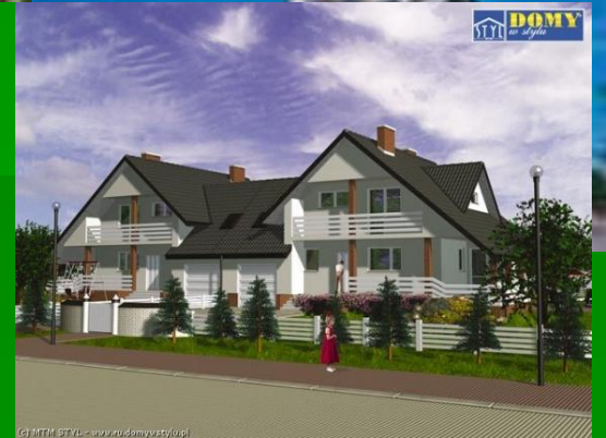
A detached house