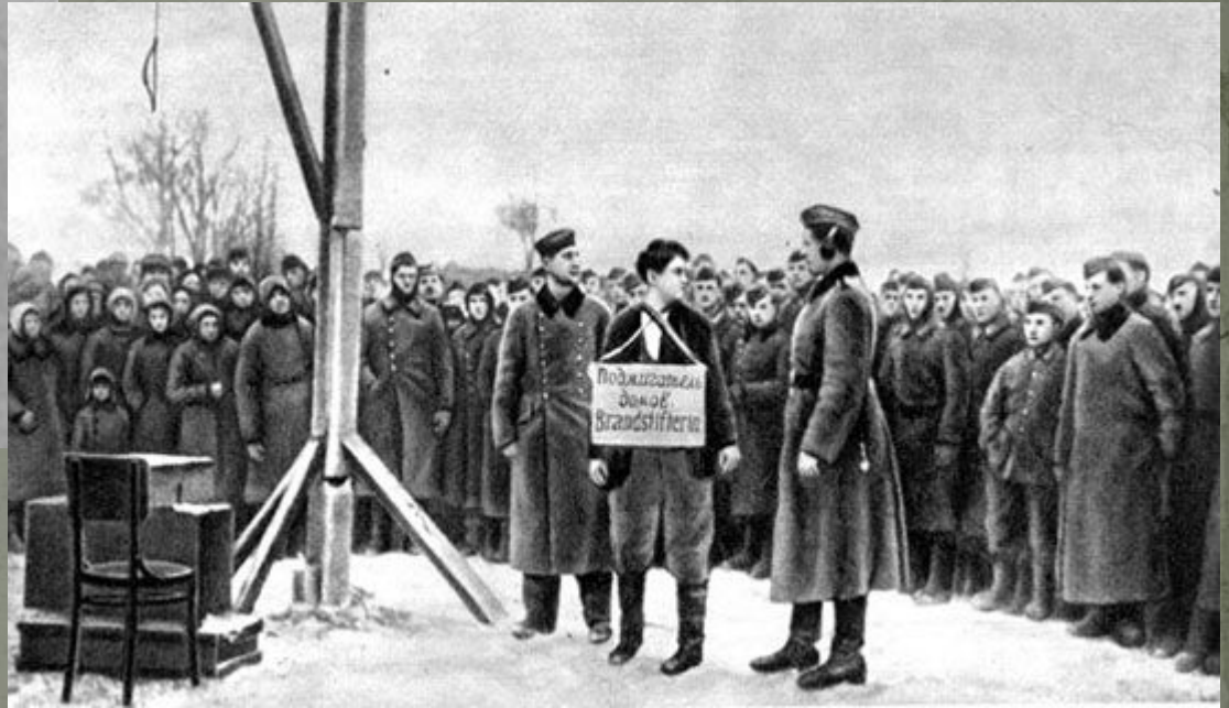
Зоя Анатольевна Космодемьянская