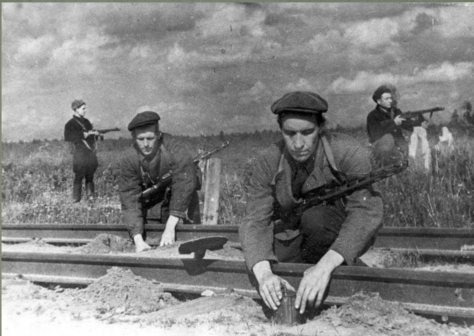
Операция «Рельсовая война»