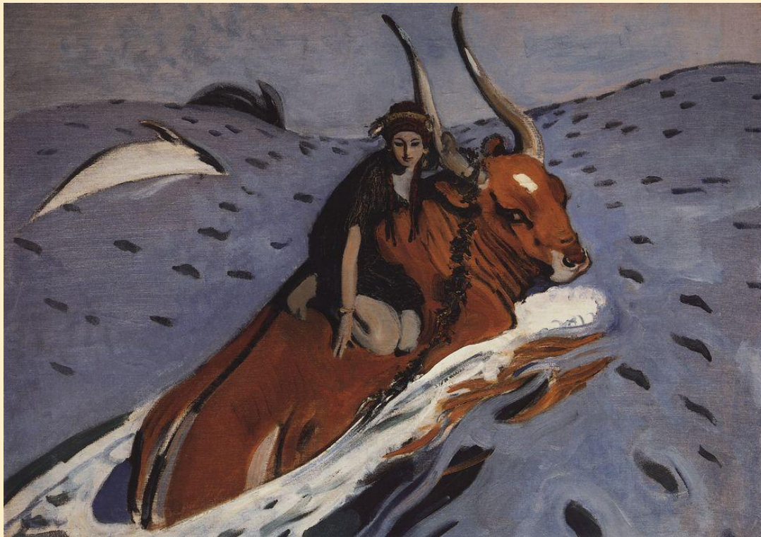
Похищение Европы. 1910 г.