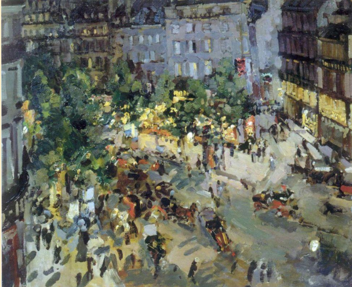
«Париж. Бульвар Капуцинок», 1906