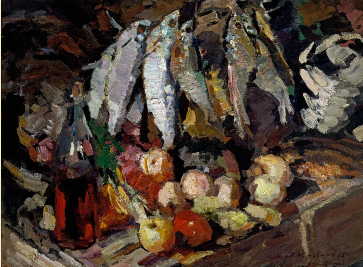
«Рыбы, вино и фрукты», 1916