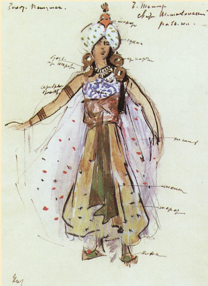
«Рабыня из свиты Шамаханской царицы»