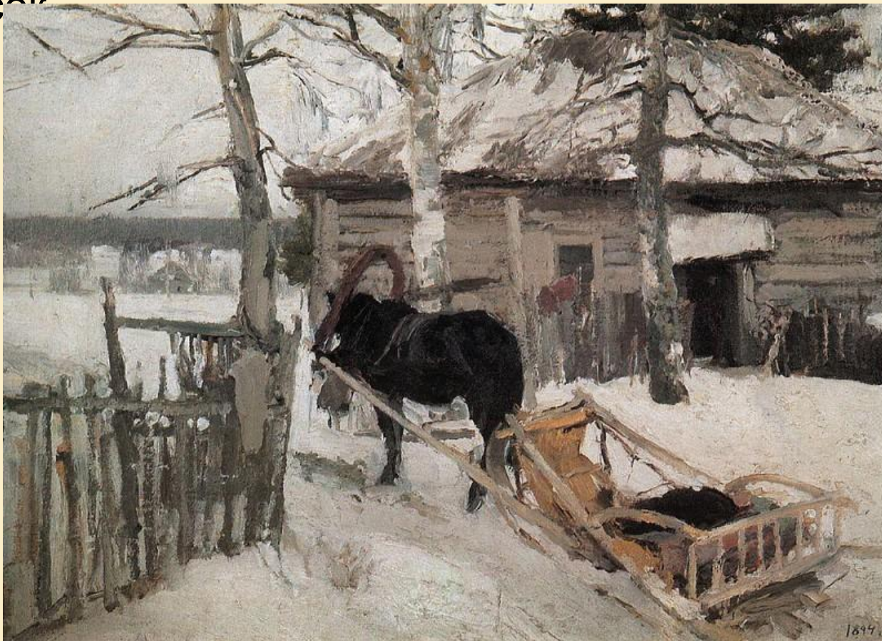
«Зимой» (1894 г.)