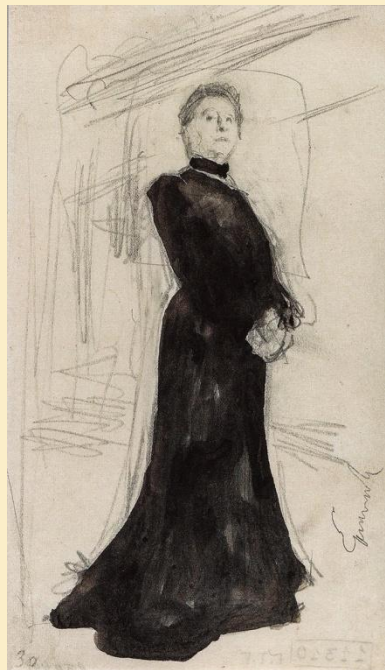
Портрет М. Н. Ермоловой. 1905 г.