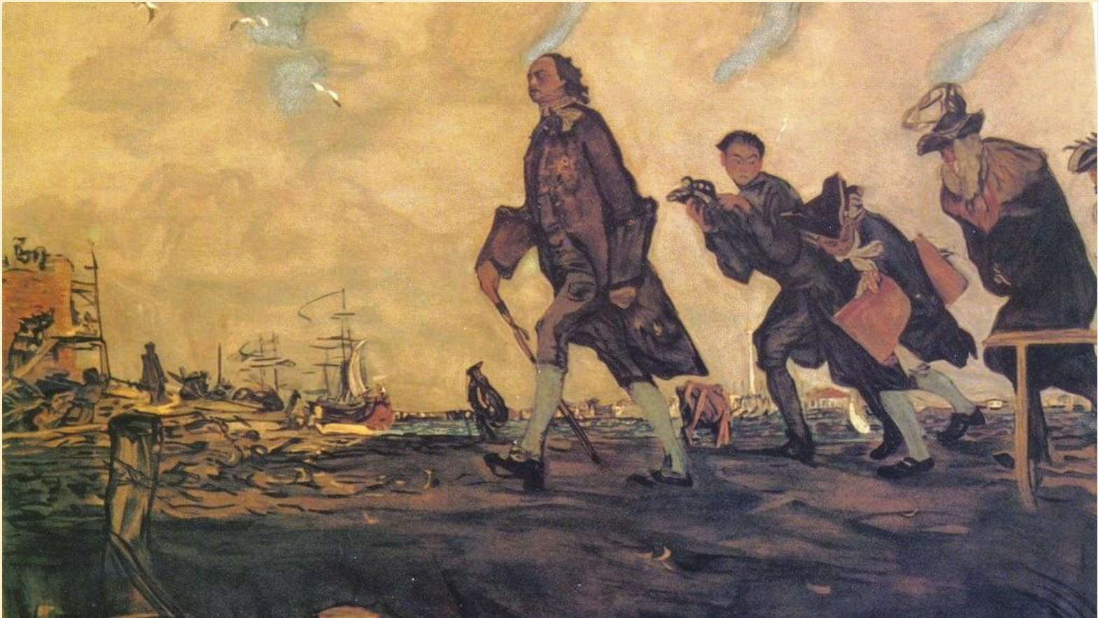
Пётр I. 1907 г.