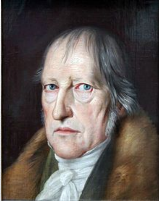
Георг Вильгельм Фридрих — немецкий философ, один из творцов немецкой классической философии и философии романтизма