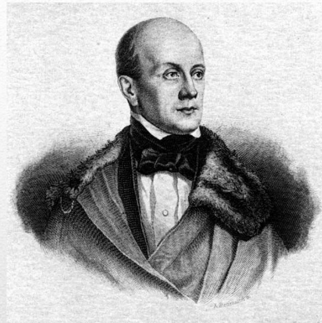
Пётр Яковлевич Чаадаёв – русский философ и публицист