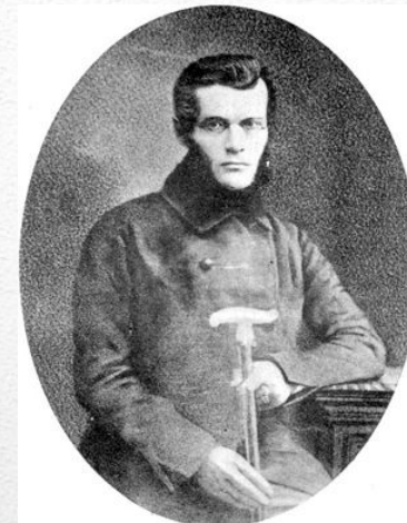
Иван Васильевич Киреевский