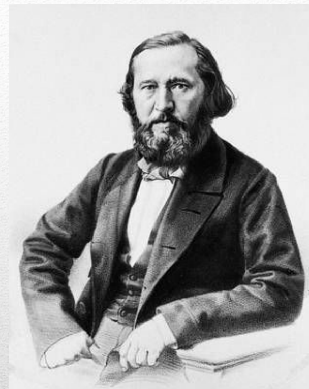
К. С. Аксаков