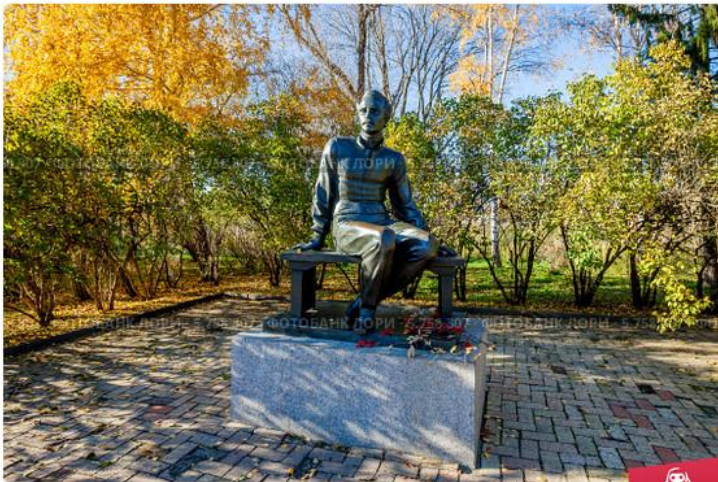
Памятник М.Ю. Лермонтову в музее-заповеднике "Тарханы", село Лер