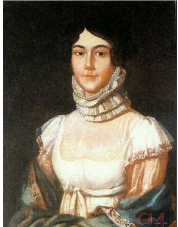
Портрет Марии Михайловны Лермонтовой

М. Лермонтов происходил из известного в России и богатого дворянского рода Столыпиных.