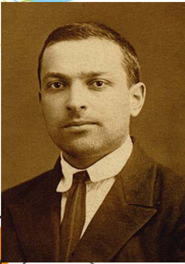
Выготский Лев Семенович (1896-1934)

Дети строят свое представление о мире, обмениваясь информацией об объектах с другими. Наделение определенным значением и толкование вещей происходят во взаимодействии с другими.