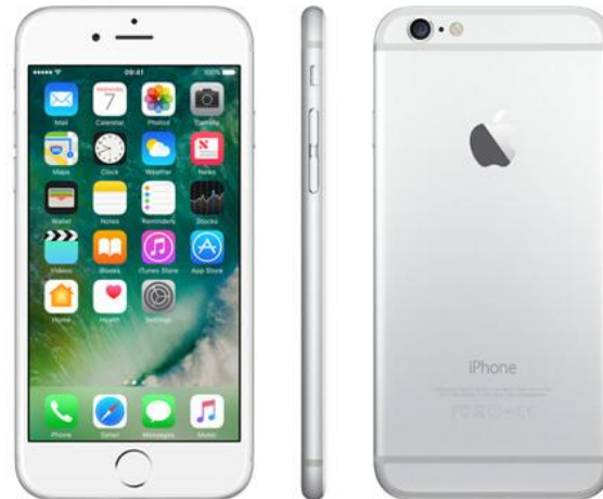
iPhone 6 Rfb