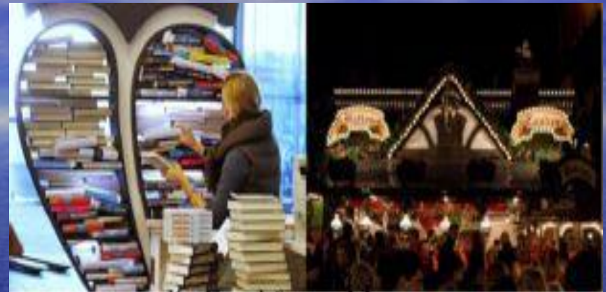
die Frankfurter Messen