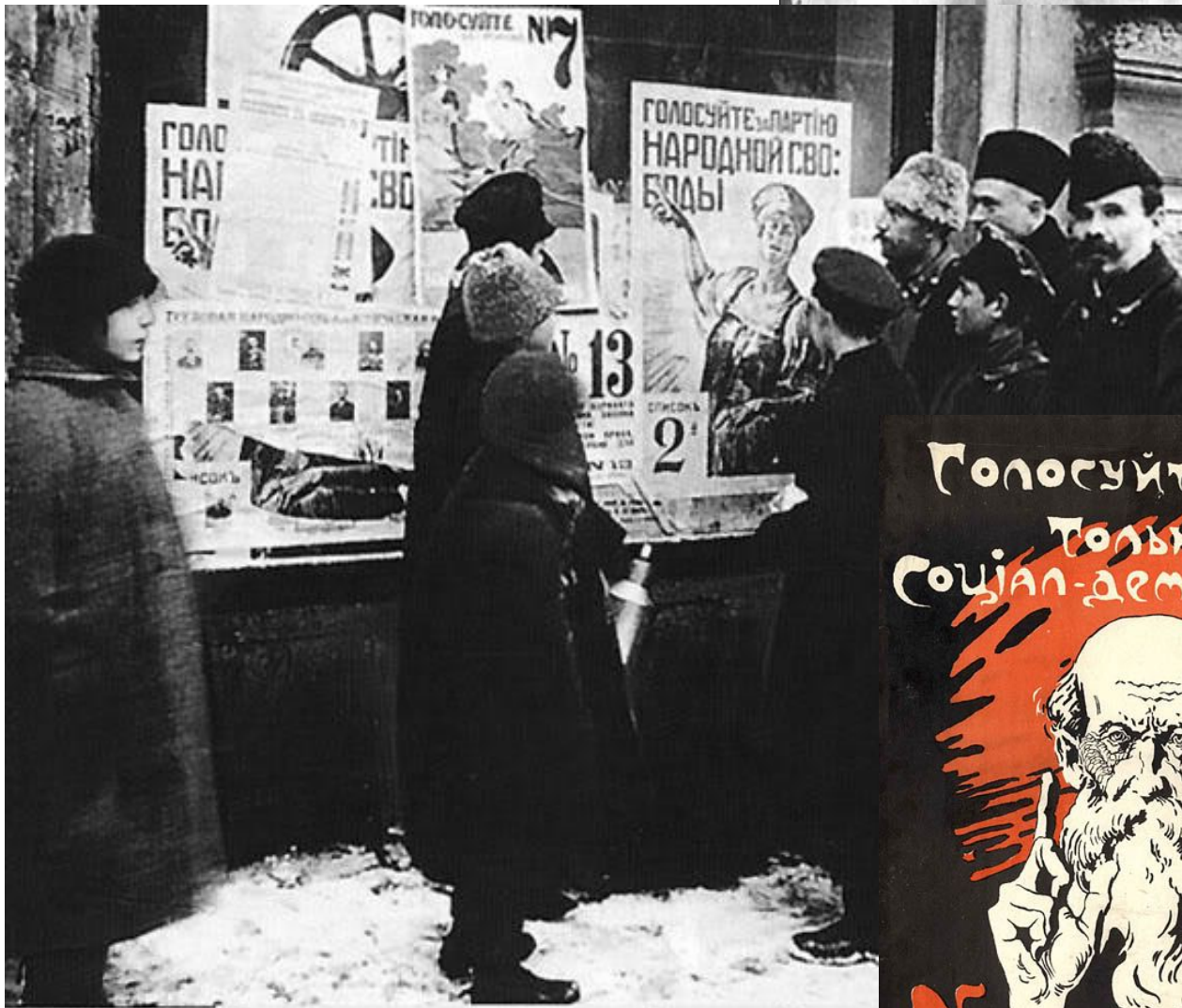
Плакаты, посвященные выборам в Учредительное собрание