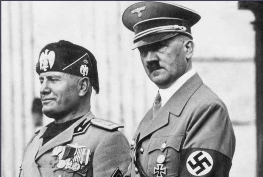
Гітлер і Муссоліні після укладення „Сталевого пакту“