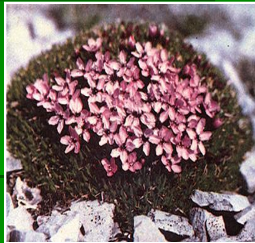
«Большой Арктический заповедник»