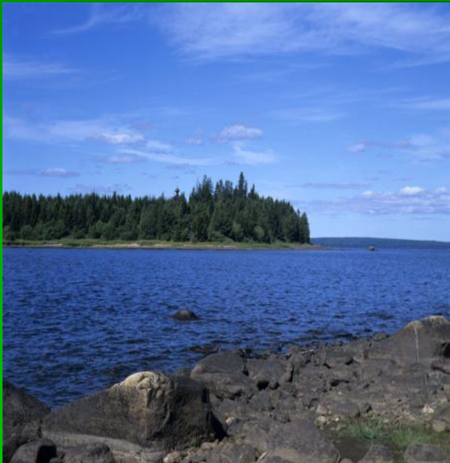
Водлозерский Национальный парк

Национальный парк – это территория или акватория с малонарушенными природными комплексами и уникальными природными объектами. В России 35 национальных парков.