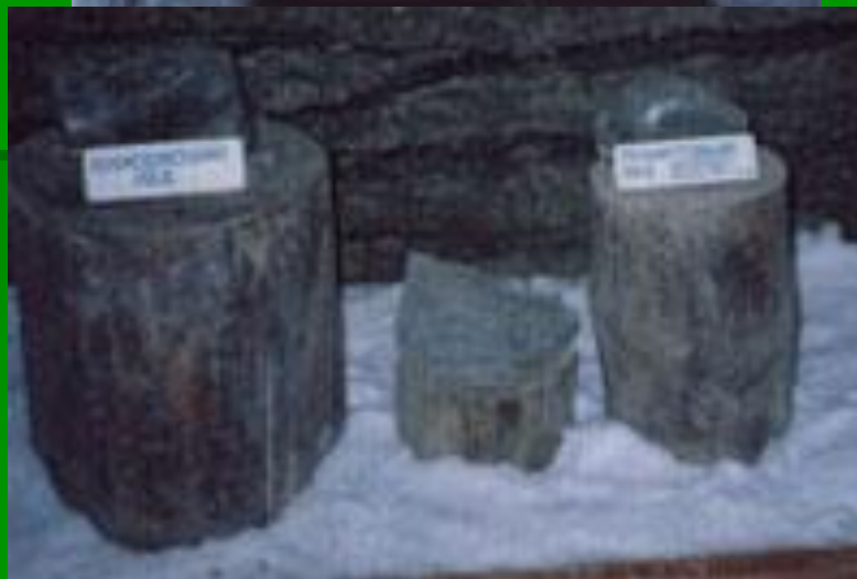
Музей вечной мерзлоты