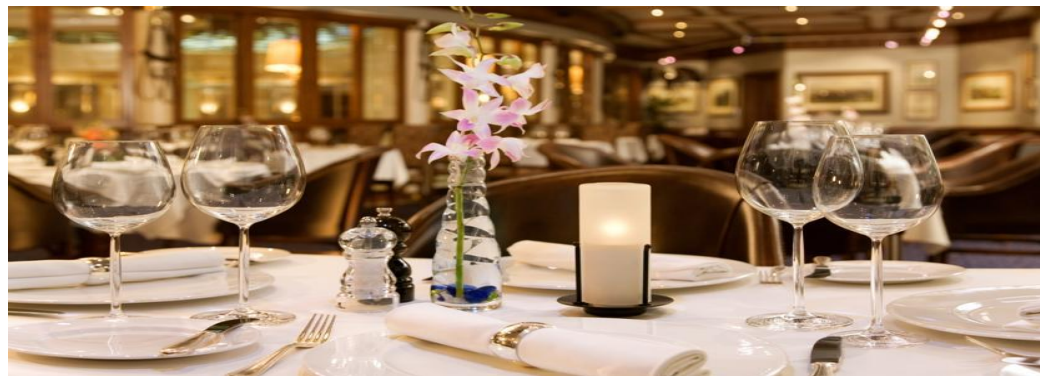
Moscow Marriott Royal Aurora Hotel, 5*, Москва