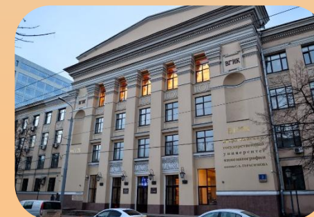
Учреждения среднего профессионального образования