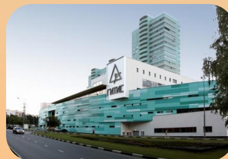
Образовательные организации высшего образования