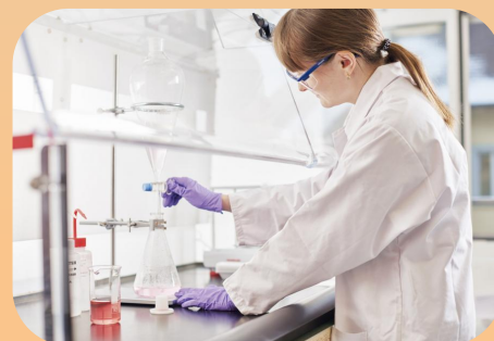
Научно- исследовательские учреждения