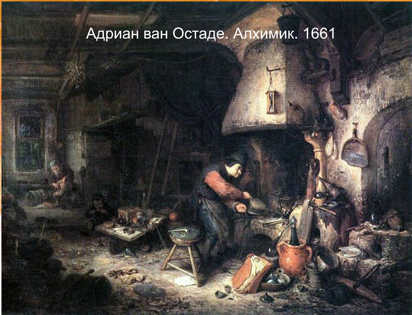
Адриан ван Остаде. Алхимик. 1661