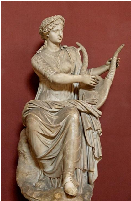
Терпсихора покровительствует танцам