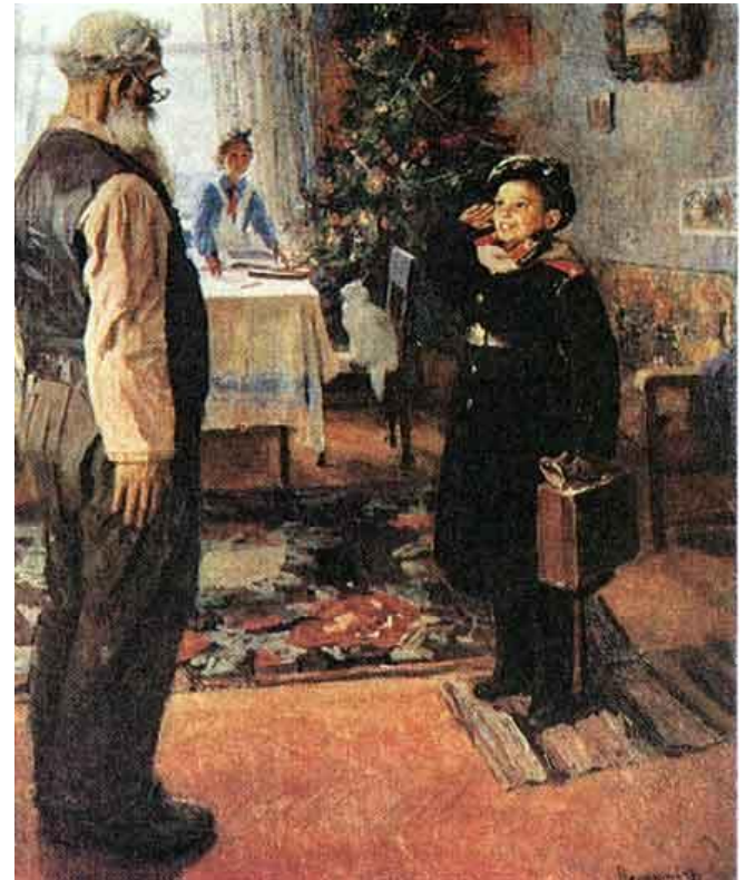
Ф. Решетников. «Прибыл на каникулы»