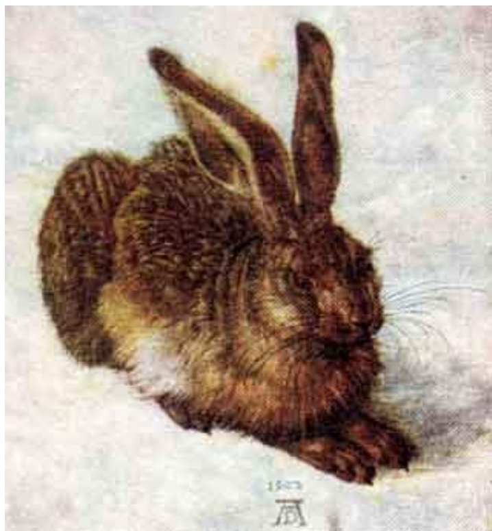
А. Дюрер «Кролик»

Это изображение животных «анимал» (лат.) «животное»