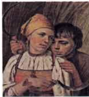
А. Венецианов. Жнецы

Изображает разные стороны жизни человека: труд и отдых, праздники и будни, забавы и серьёзные занятия.