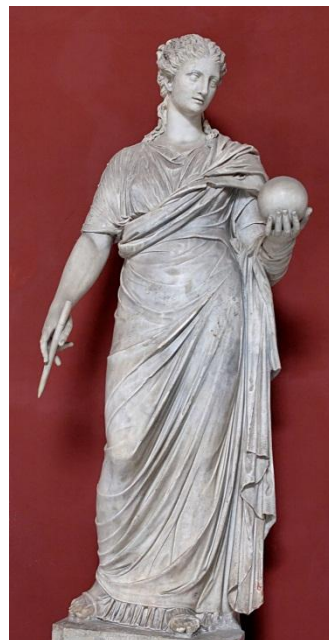
Урания покровительств ует астрономии