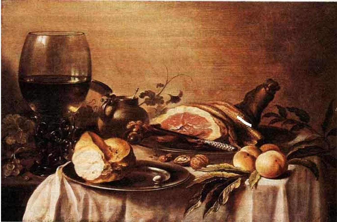
Питер Класс (Голландия) «Завтрак с ветчиной»