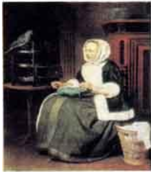
Г. Метсю. Девушка за работой.

Изображает разные стороны жизни человека: труд и отдых, праздники и будни, забавы и серьёзные занятия.