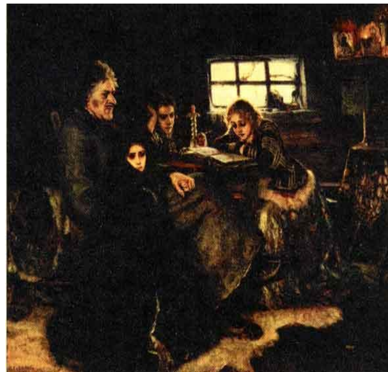
В. Суриков «Меньшиков в Берёзове»