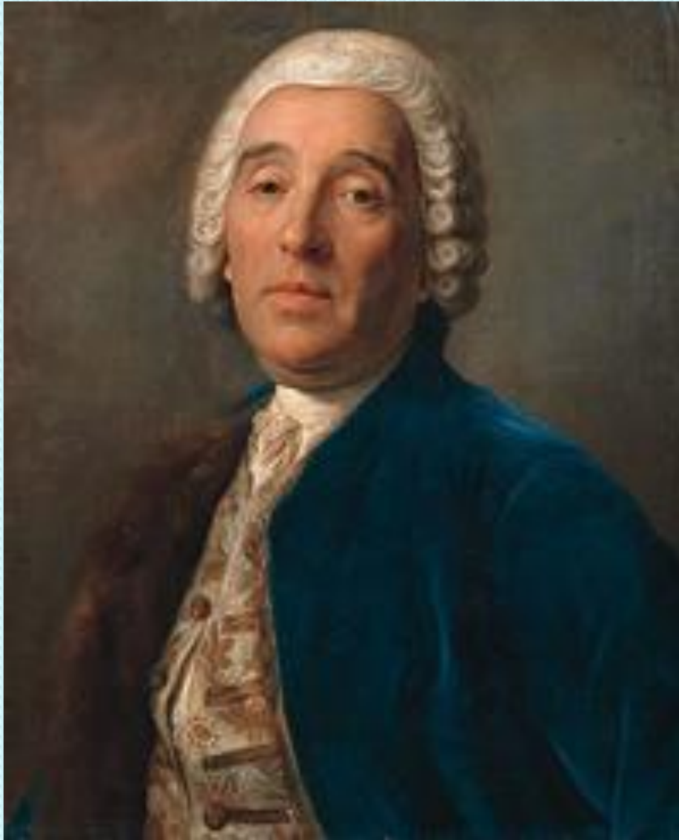
Бартоломео Франческо Растрелли. 1700-1771