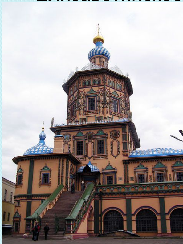
Петропавловский собор, Казань