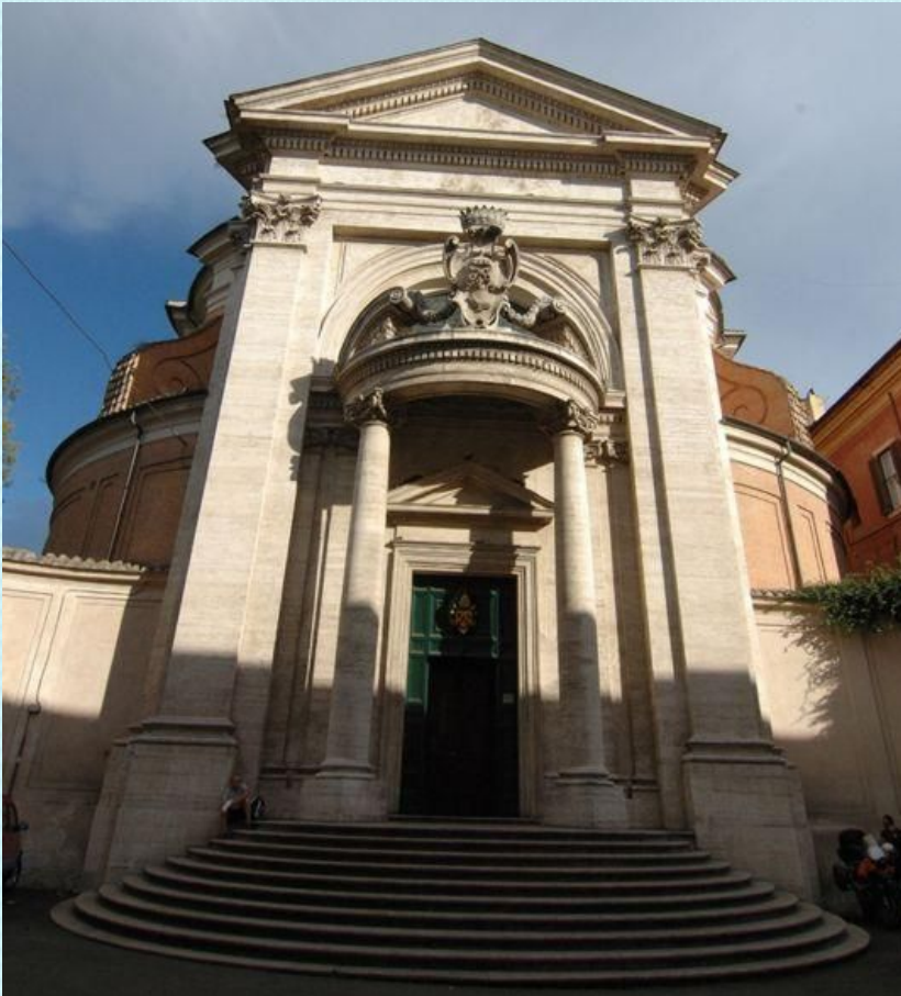
Церковь Сант Андреа ин Квиринале в Риме. Лоренцо Бернини

Большую роль в развитии итальянского барокко сыграл Ватикан. Католическая церковь в стремлении поднять свой престиж возводила многочисленные храмы. Характерные черты итальянского барокко нашли наиболее яркое воплощение в творчестве Франческо Борромини и Лоренцо Бернини.