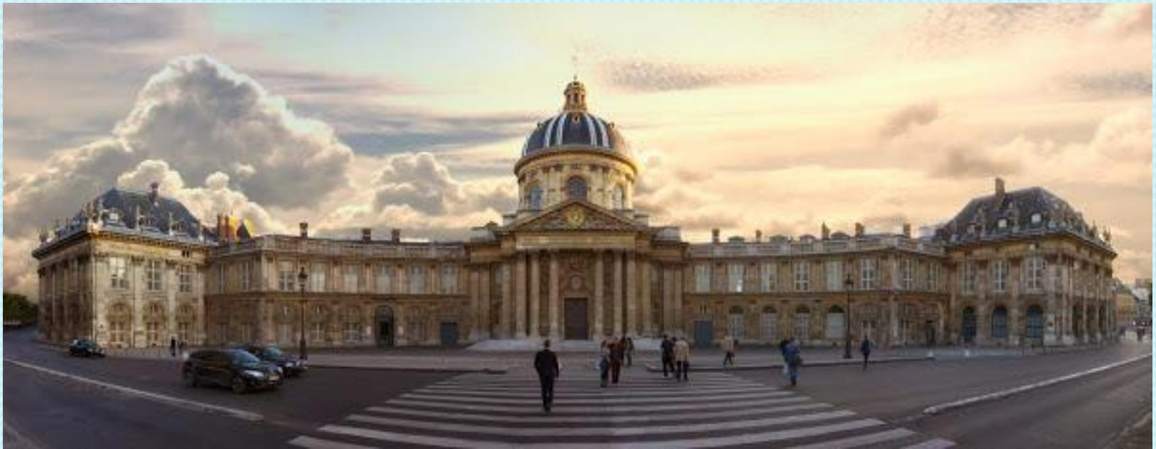
Луи Лево. Колледж четырех наций (1662-1667)

Во Франции Барокко как стиль в архитектуре стал популярным в XVII-XVIII веков. Французскому барокко свойственная большая строгость. Наиболее выдающимися французскими зодчими, работавшими в стиле барокко, считаются Жак Лемерсье и Жюль Ардуен Мансар.