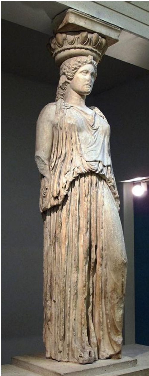
Кариатида из Эрехтейона в контрапосте. Британский

Маскаро́н – вид скульптурного украшения здания в форме головы человека или животного анфас.