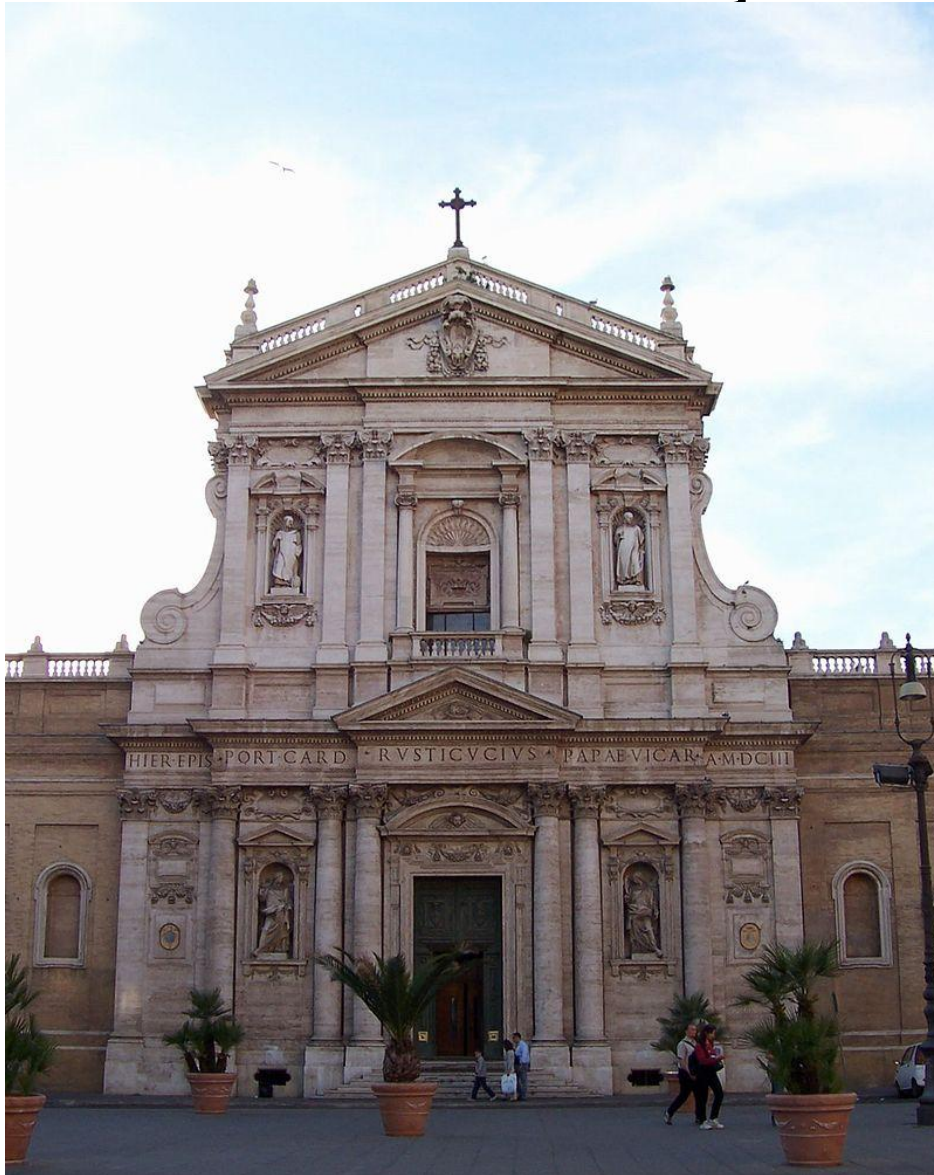
Карло Мадерна Церковь Святой Сусанны, Рим