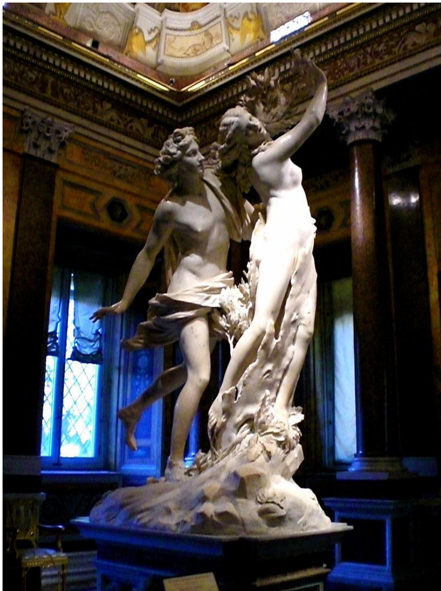
«Аполлон и Дафна» Лоренцо Бернини