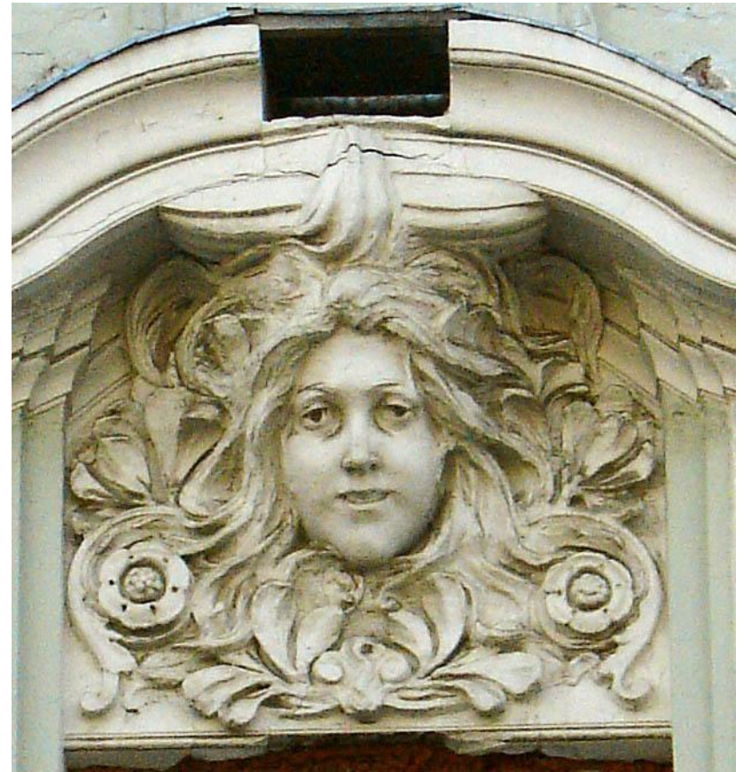
Женская головка. Москва