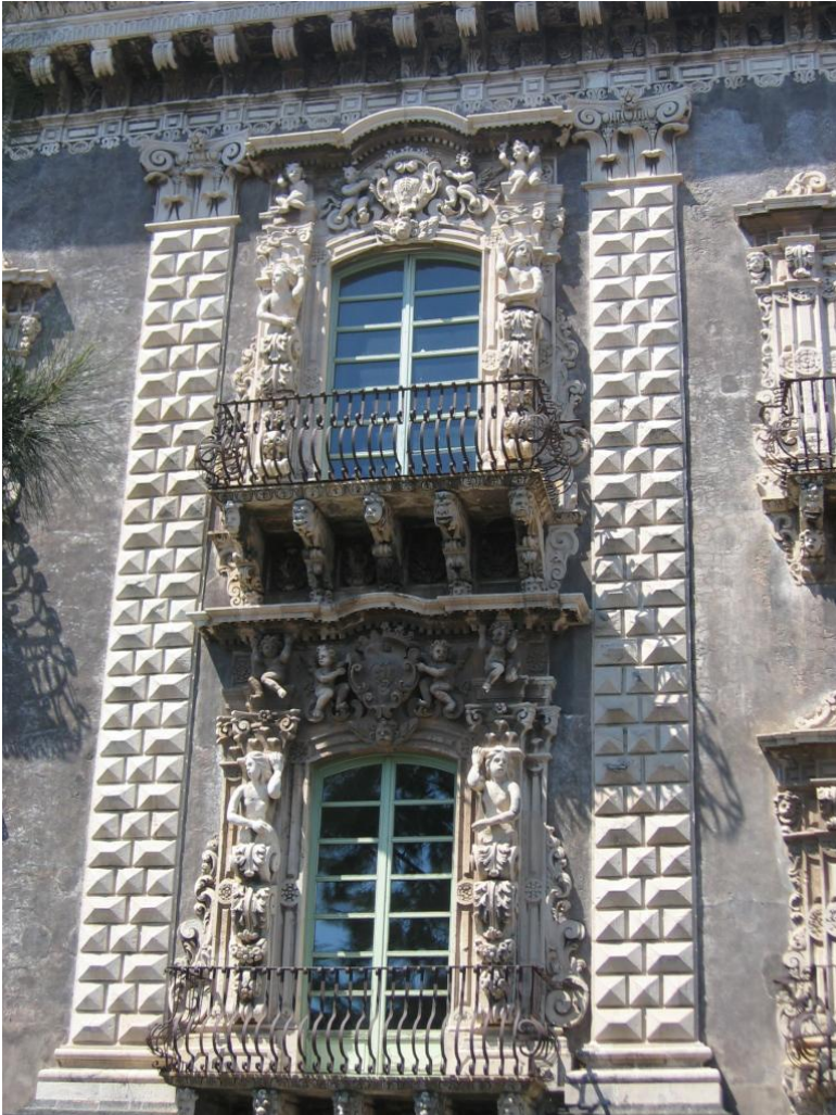
Рустованная пилястра здания университета в Катании

Пилястр — вертикальный выступ стены, обычно имеющий (в отличие от лопатки) базу и капитель, и тем самым условно изображающий колонну.