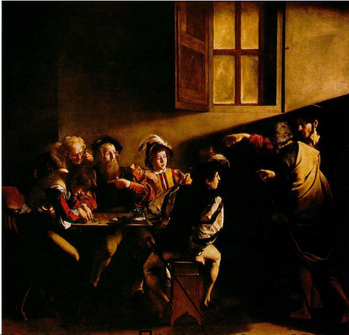
Караваджо. Призвание апостола Матфея