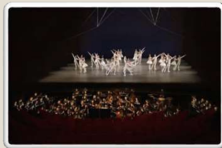
Дирижер Симфонический оркестр