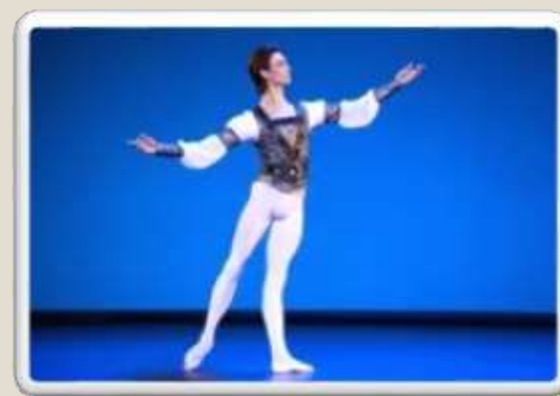
Танцоры – солисты