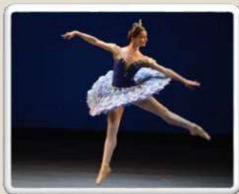
Балерины – солисты