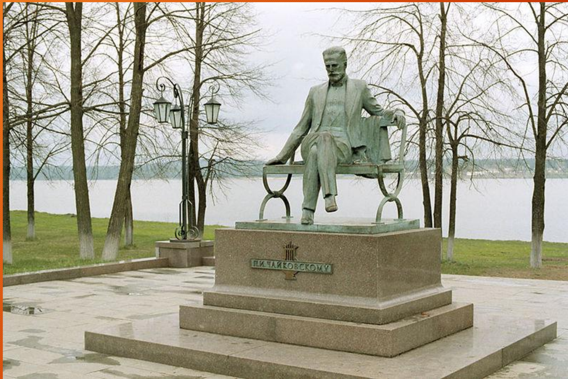
Памятник Петру Чайковскому в Воткинске.