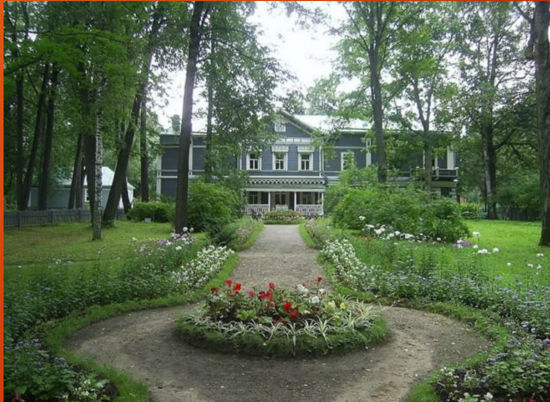
дом в Клину Петра Ильича Чайковского,

Чайковский стал первым из русских композиторов, который еще при жизни добился мировой славы. Регулярно занимаясь дирижированием, в конце 1887 - начале 1888 года он совершает первое европейское турне как дирижер. "Сколько было восторгу, и все это не мне, а голубушке России", - записал он в своем дневнике после одного из концертов в Праге. В 1891 году он совершил триумфальную концертную поездку в США.