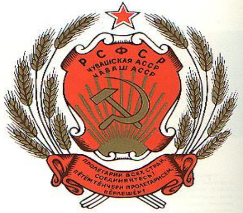
Государственный герб ЧАССР 1938-1992

Государственный герб Чувашской Автономной Советской Социалистической Республики представляет собой изображение серпа и молота на красном фоне, в лучах солнца и в обрамлении колосьев, с надписью «РСФСР» на русском языке и «Пролетарии всех стран, соединяйтесь!» на русском и чувашском языках с добавлением под надписью «РСФСР» буквами меньшего размера надписи «Чувашская АССР» на русском и чувашском языках. В верхней части герба - пятиконечная звезда