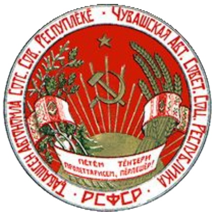
Государственный герб ЧАССР 1927–1931

Герб состоит из изображений на красном фоне в золотых лучах солнца золотых серпа и молота, расположенных крест-накрест рукоятками книзу, окруженных венком, состоящим из колосьев с правой стороны и дубовых и еловых веток с левой стороны, перевитым снизу лентой с красной каймой с чувашскими орнаментами на концах и с надписью в середине: «Пѣтѣм тѣнчери пролеттарисем, пѣрлешӗр!». Над серпом и молотом помещается золотая пятиконечная звезда. Вокруг венка надпись с левой стороны: «Чăвашсен Автономлă Соц. Сов. Республăкĕ», с правой стороны: «Чувашская Авт. Совет. Соц. Республика» и внизу, между вышеуказанными надписями «РСФСР»