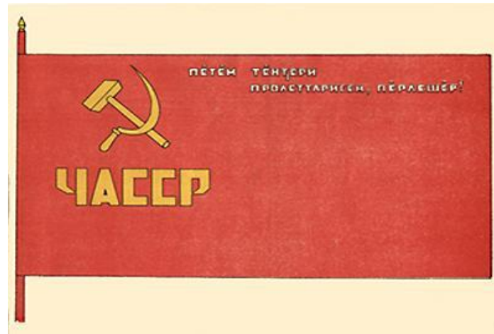
Государственные герб и флаг Чувашской АССР 1931-1938