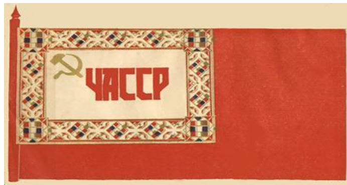
Государственные герб и флаг Чувашской АССР 1927-1931