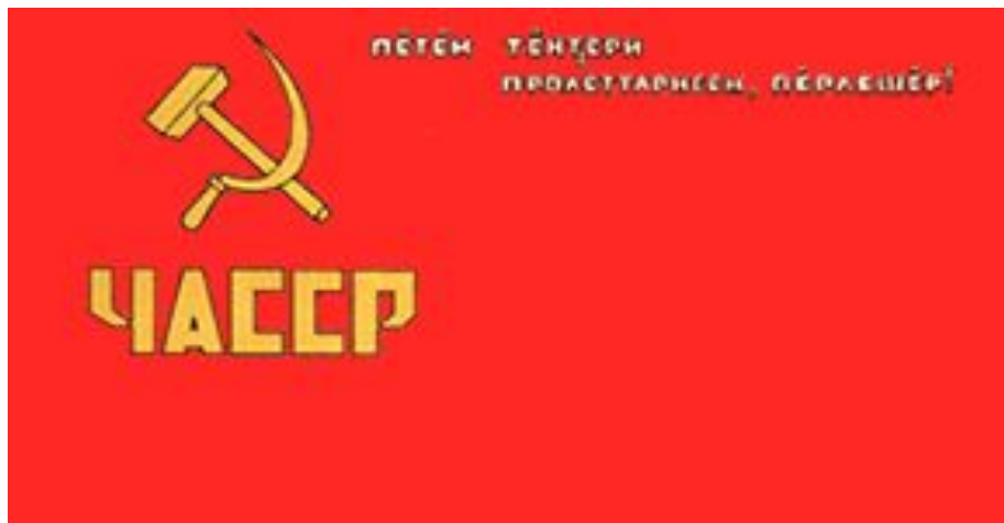
Государственный флаг Чувашской АССР 1931–1938