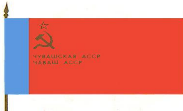
Государственные герб и флаг Чувашской АССР 1938-1992