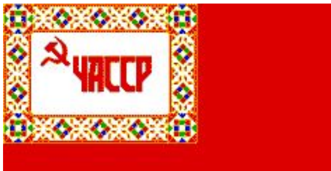
Государственный флаг ЧАССР 1927–1931

Флаг состоит из красного или алого полотнища, на верхнем левом углу которого обрамленное чувашским орнаментом белое полотно с красными буквами «ЧАССР», впереди коих в верхнем углу серп и молот, расположенные крест-накрест рукоятками к низу.