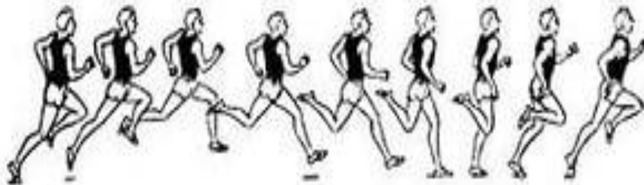
Рис. 45. Бег 400 м по прямой

Хороший эффект в овладении структурой беговых движений дает выполнение беговых упражнений без помощи рук, а также переключения с работой рук и без них.