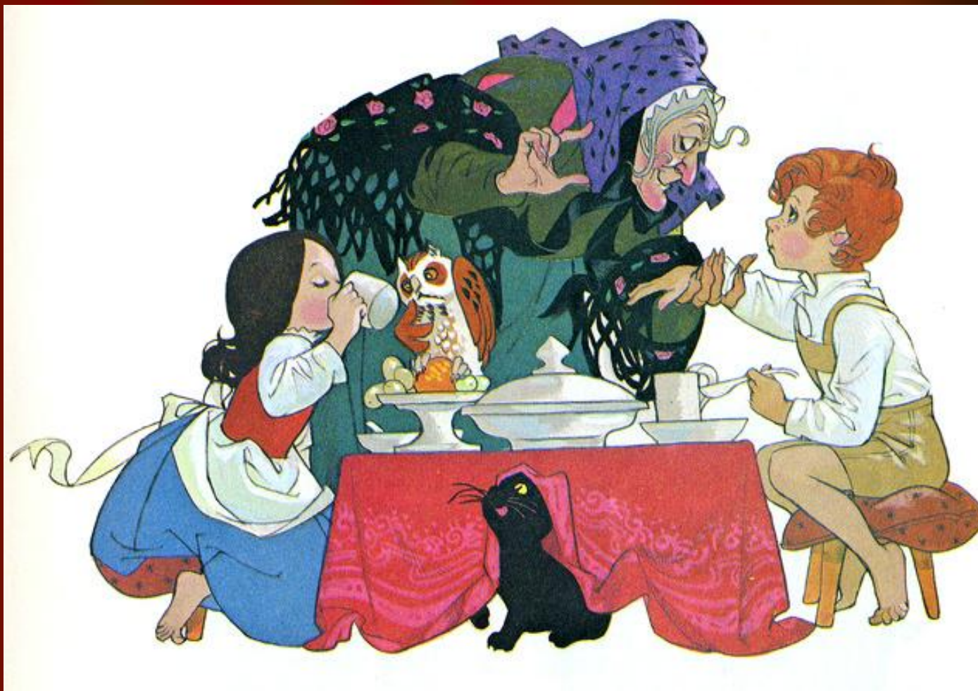
Иллюстрация к сказке «Гензель и Гретель»