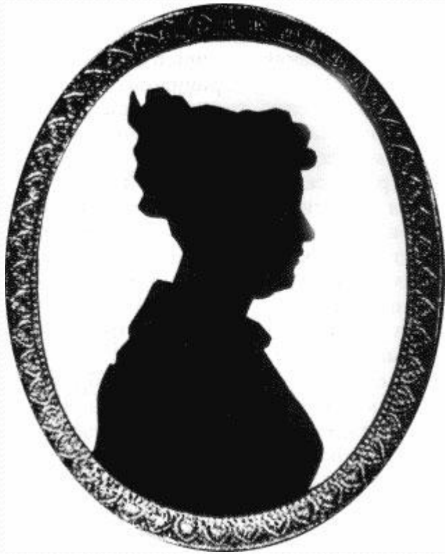
Анна Петровна Керн