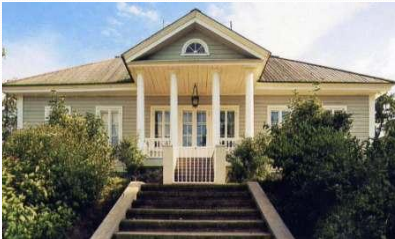
Вид дома с северной стороны

К 200-летию поэта проведена большая реконструкция всей усадьбы. Старинный дом, построенный О.А. Ганнибалом, в котором жил А.С. Пушкин, не сохранился, но восстановлен таким, каким был при жизни поэта.