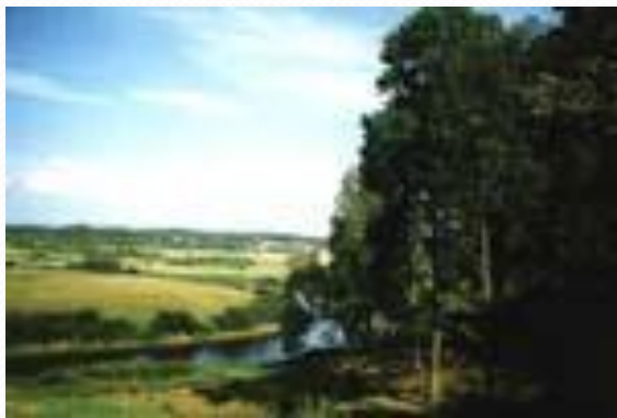
Вид на реку Сороть

Живописный вид открывается с околицы Михайловского на озеро Кучане и Маленец, речку Сороть и "мельницу крылату", "холм лесистый" и Савкину горку.