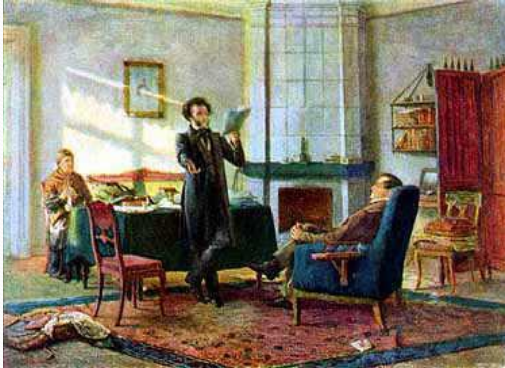
И.И.Пущин в гостях у А.С. Пушкина в Михайловском