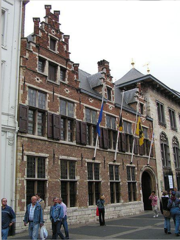
Дім Рубенса в Антверпені.