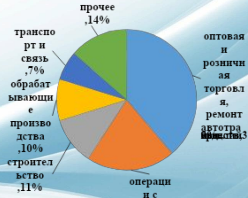
Рисунок 2 – Структура видов экономической деятельности малых предприятий в 2014 г.