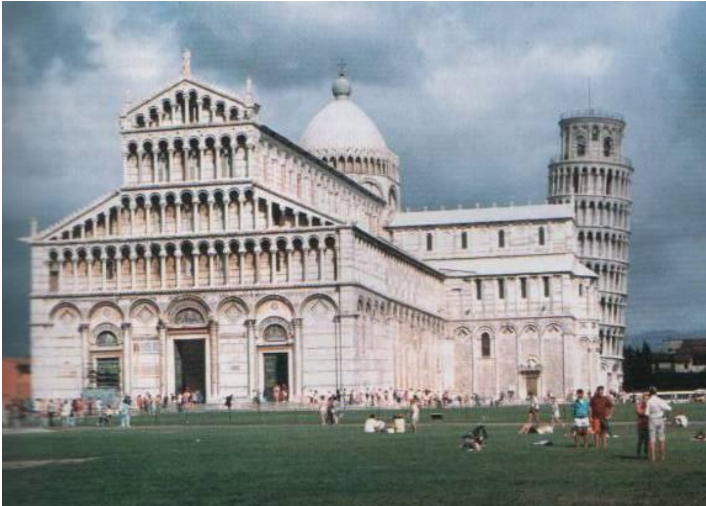
Пизанский собор. 11 -12вв. Италия