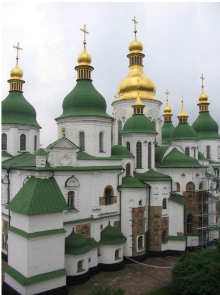
Собор Святой Софии в Кеве. 11в.