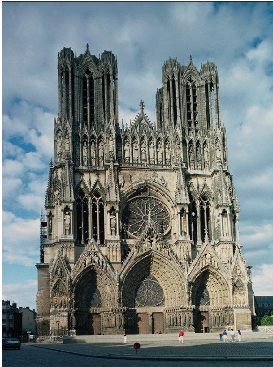
Собор Реймсе. 13 -15в. Франция