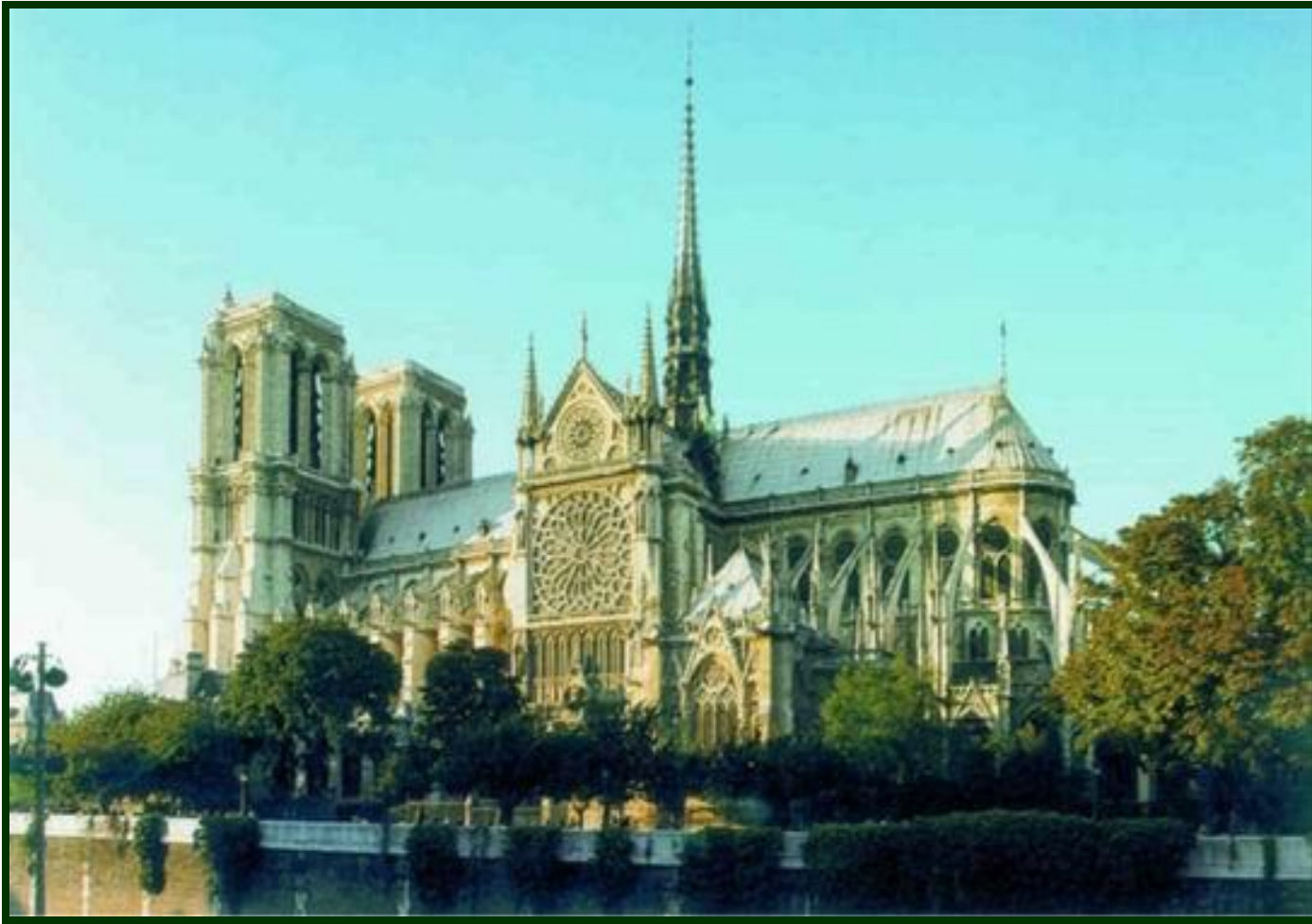
Собор Нотр - Дам. 13-14 вв. Париж, Франция