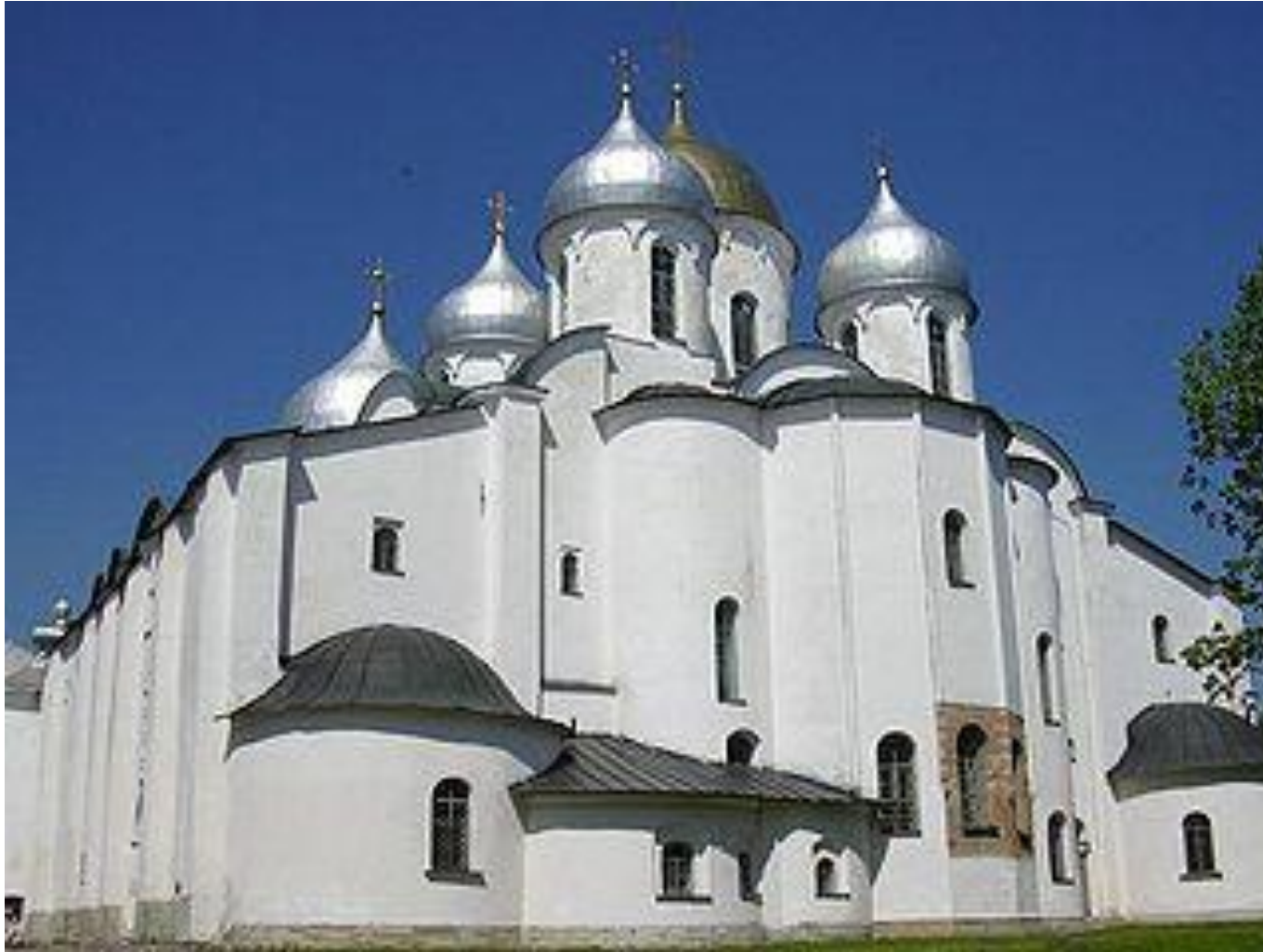
Собор Святой Софии в Новгороде Великом. 11в.