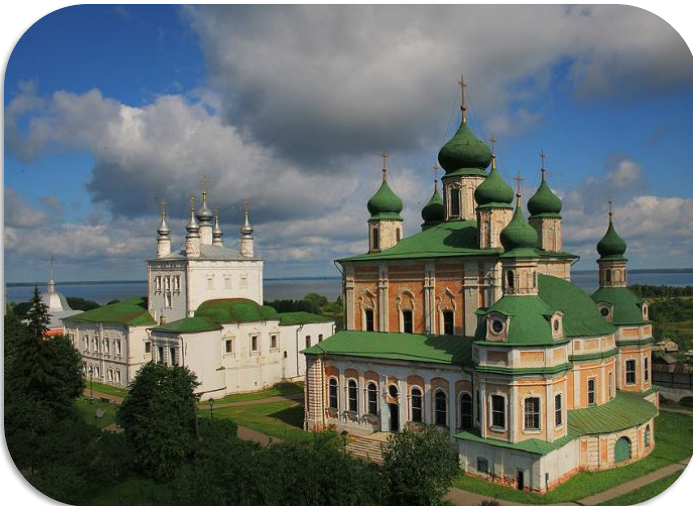
Горицкий Успенский монастырь

Горицкий Успенский монастырь возник в XVI в. при Иване Калите. Монастырь находится на возвышенности у южного берега Плещеева озера. Благодаря своему местонахождению он виден отовсюду. В настоящее время в стенах Горицкого монастыря расположен Переславский историко-художественный музей.