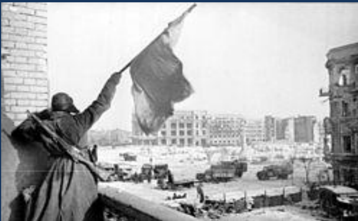
Флаг над освобождённым городом, Сталинград, 1943 года