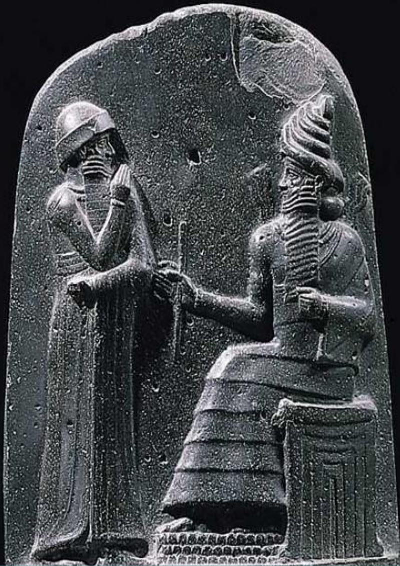
Шамаш выдает Хаммурапи законы и жезл власти

Кто в стране имеет самый большой авторитет?