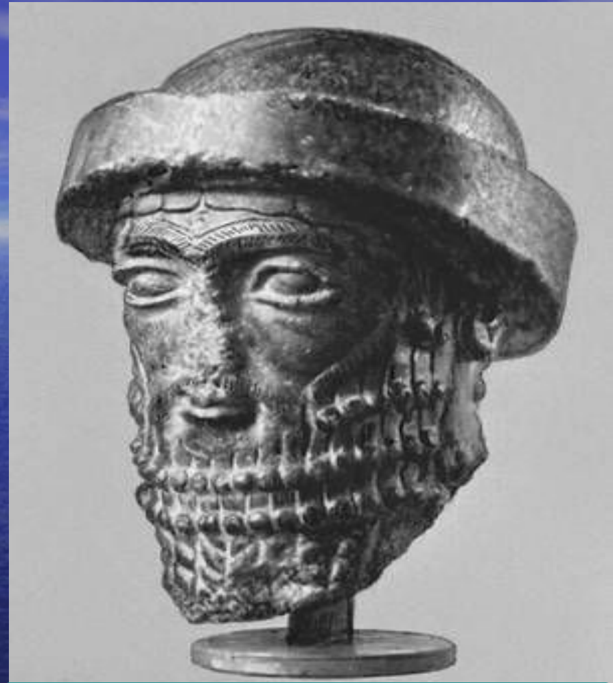
Каменный бюст Хаммурапи