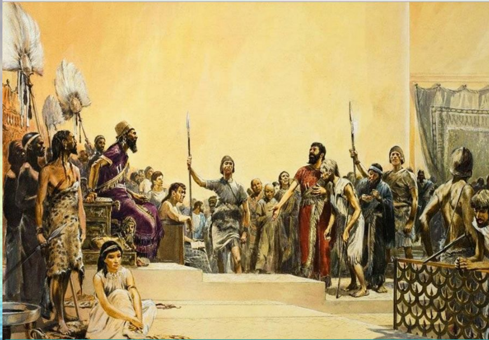
Вавилонский судья и обвиняемый

Законы Вавилона предписывали наказывать преступников в соответствии с ущербом который они нанесли. Применялся принцип «око за око». То есть если преступник нанес травму, ему наносили такую же. Если он кого-то убивал, его казнили. Если судьи не могли решить вину подсудимого, они применяли «божий суд». Бросали связанного человека в реку, и если он невиновен боги