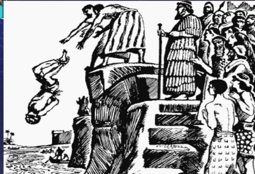
Божий суд Вавилона