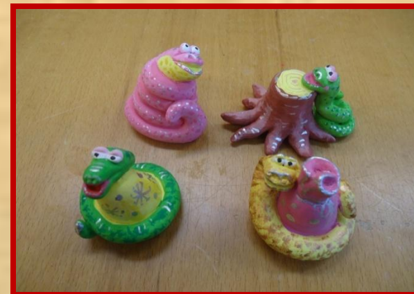
Раскрашивание и декор поделки