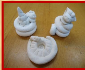
Грунтование белой краской