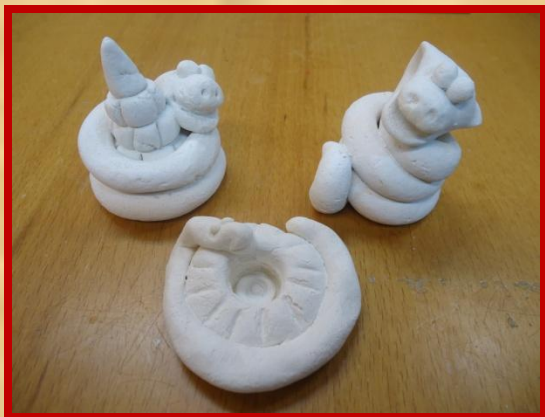
Грунтование белой краской