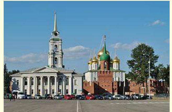
Вид на башню Одоевских ворот и Успенский собор

Деревянный сруб, начинаясь в районе нынешнего Зареченского моста от Никольских ворот, шёл по Советской улице до Крапивенской башни, имевшей форму шестиугольной призмы. Крапивенская башня стояла на пересечении нынешних улицы Советской и проспекта Ленина. Здесь дубовая стена примыкала к древнему земляному валу, шедшему от крапивенских ворот по Завальской улице (сейчас тоже Советская) и оканчивавшемуся у самого берега Упы Никитскими воротами. Отсюда вновь начиналась дубовая стена и шла вдоль всего берега до Никольских ворот.