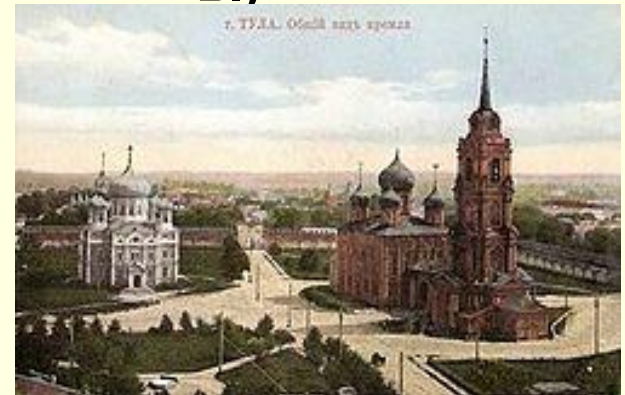
Кремль в начале XX в.