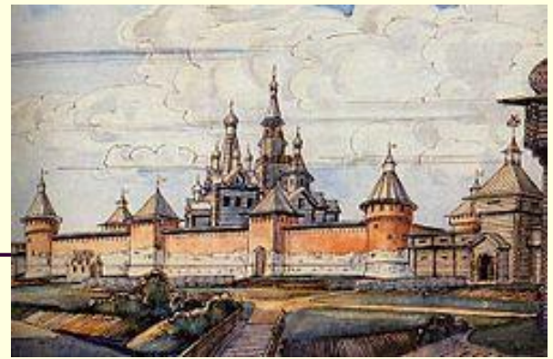
Реконструкция тульского кремля (XVI в.)

10 ноября 2016 года Президент России подписал указ о праздновании в