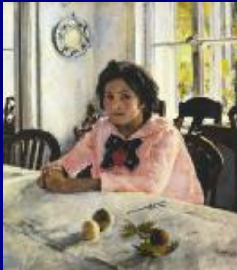
В. Серов. «Девочка с персиками»