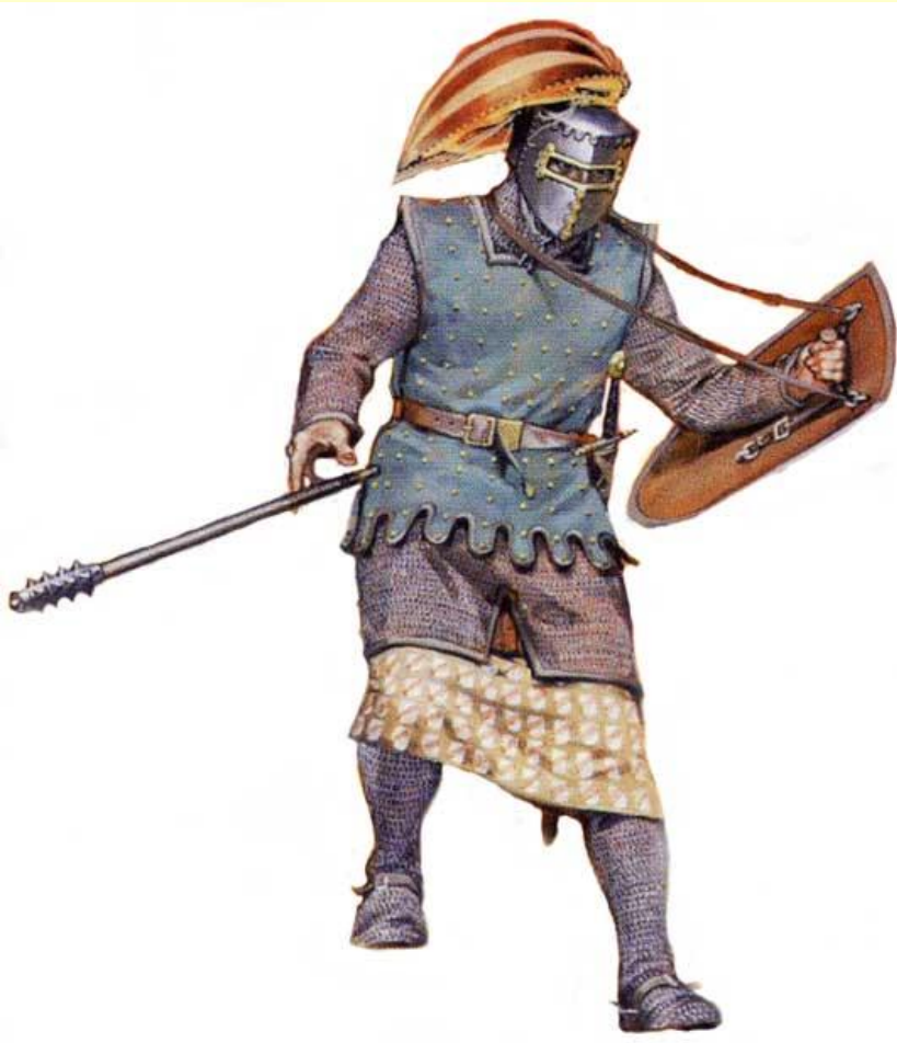
Леонский идадьго. Начало XIII в.

Короли Леона и Кастилии раздавали отвоеванные у мавров земли и светской знати.