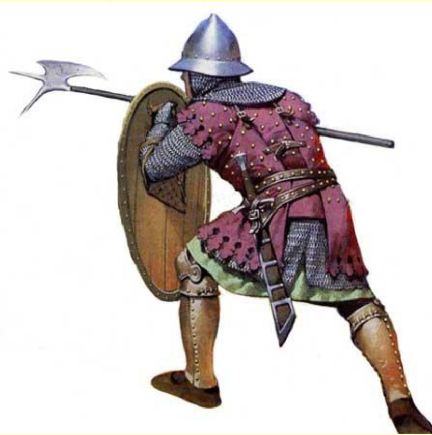
Испанский пехотинец. Середина XIV в.