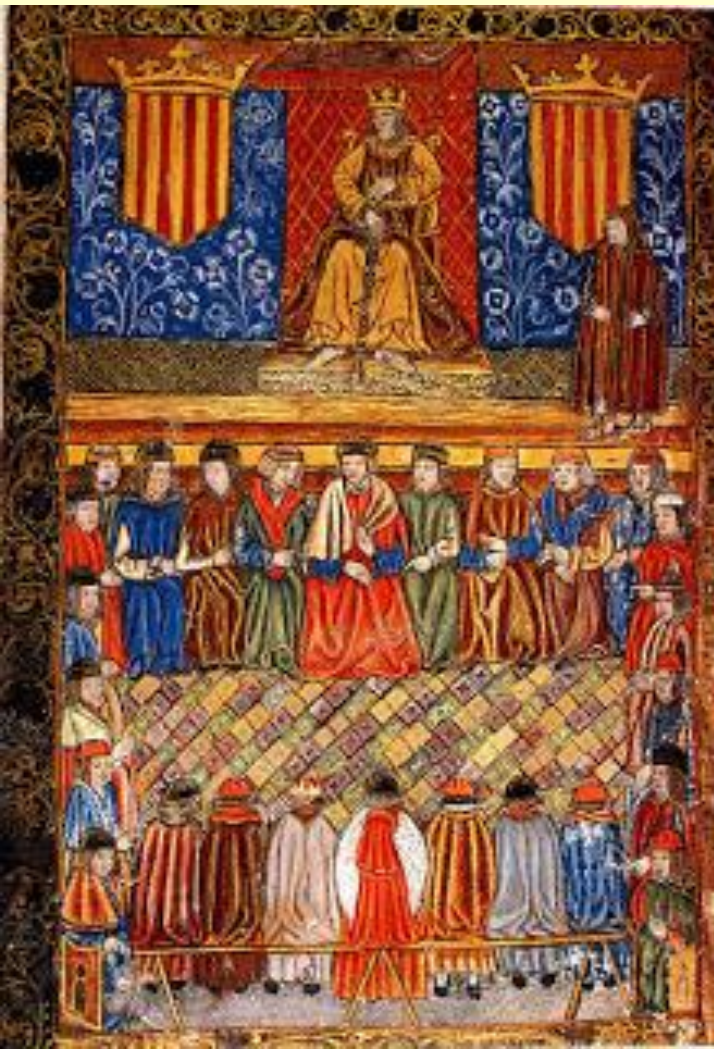
Заседание кортесов Каталонии.

Участие горожан и крестьян в Реконкисте привело к тому, что в пиренейских государствах раньше, чем в остальной Европе появились сословные представительные органы – кортесы .