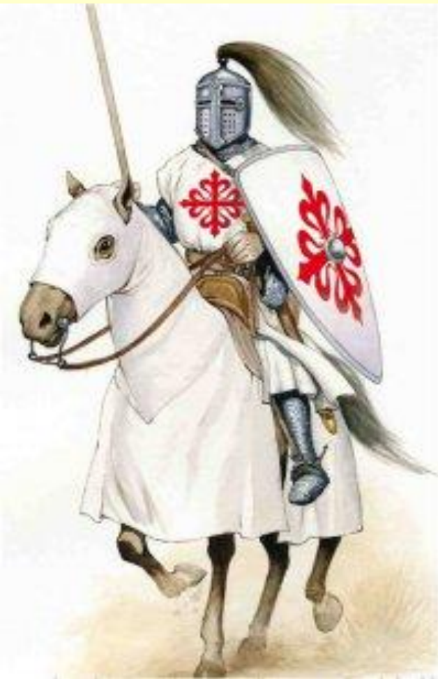
Рыцарь ордена Калатравы.