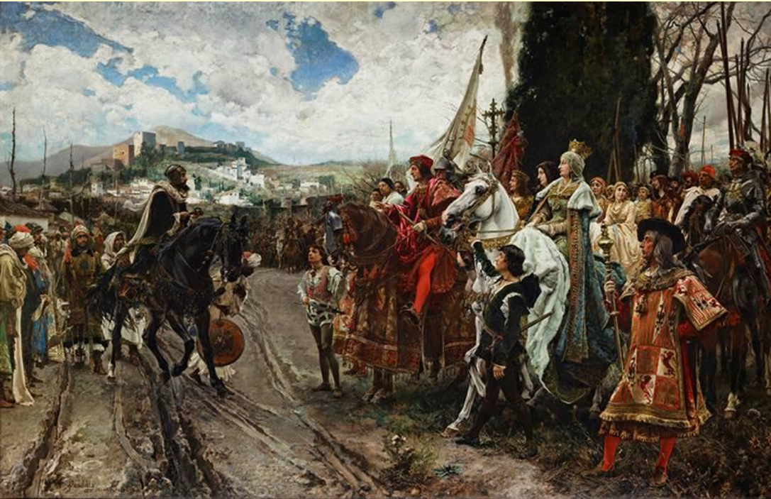
Сдача Гранады их Испанским Величествам Изабелле и Фердинанду. Худ. Франсиско Прадилья.

В январе 1492 г. после 9-месячной осады испанские войска овладели Гранадой.