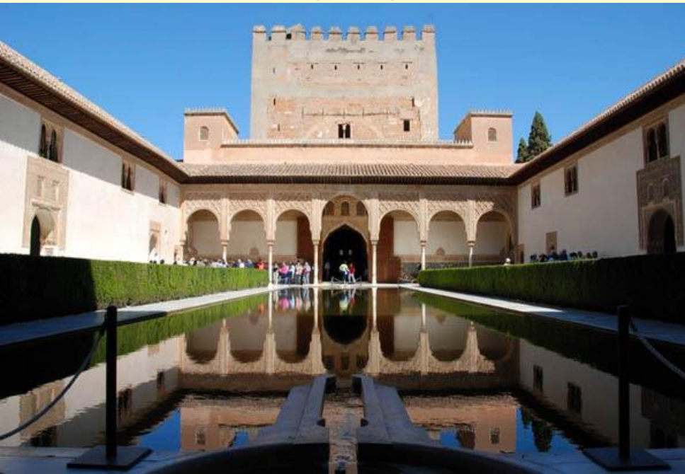
Альгамбра — дворец эмиров Гранады.

Настоящий расцвет переживала наука: мусульманские и иудейские ученые создавали трактаты по философии, математике, астрономии, медицине.