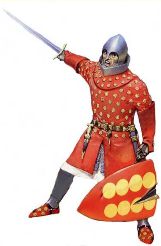
Арагонский идадьго. Начало XIV в.

Ниже рикос омбрес стояли идальгос («люди особого достоинства»), составлявшие основную массу испанского дворянства.