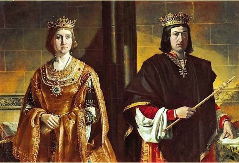
Изабелла Кастильская и Фердинанд Арагонский.

В 1469 г. наследница кастильского престола Изабелла вышла замуж за арагонского принца Фердинанда. Спустя 10 лет в 1479 г. Кастилия и Арагон заключили унию, положившую начало Испанскому королевству.