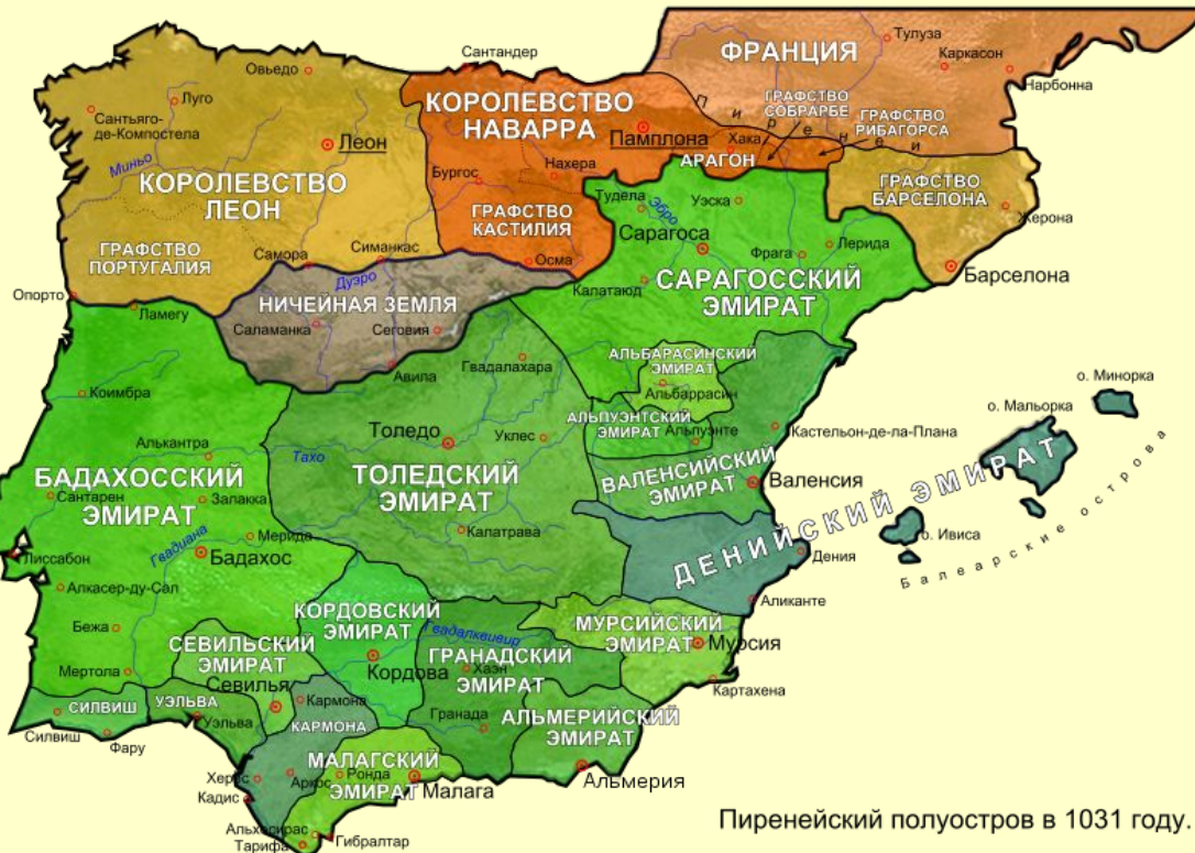
Пиренейский полуостров в 1031 году.

Действия христиан облегчали междоусобицы арабских правителей и распад Кордовского халифата на множество самостоятельных эмиратов.