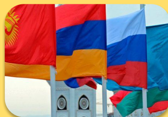
Деятельности в рамках ТС