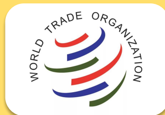
Деятельности в рамках ВТО