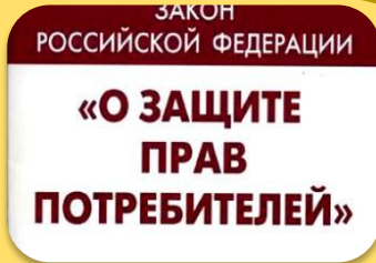
Защиты прав потребителя