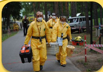
Эпидемиологи ческого надзора