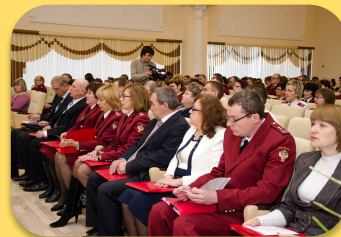
Госслужбы и кадров