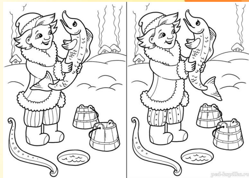
Рис. 2 Упражнение «Найди отличия»