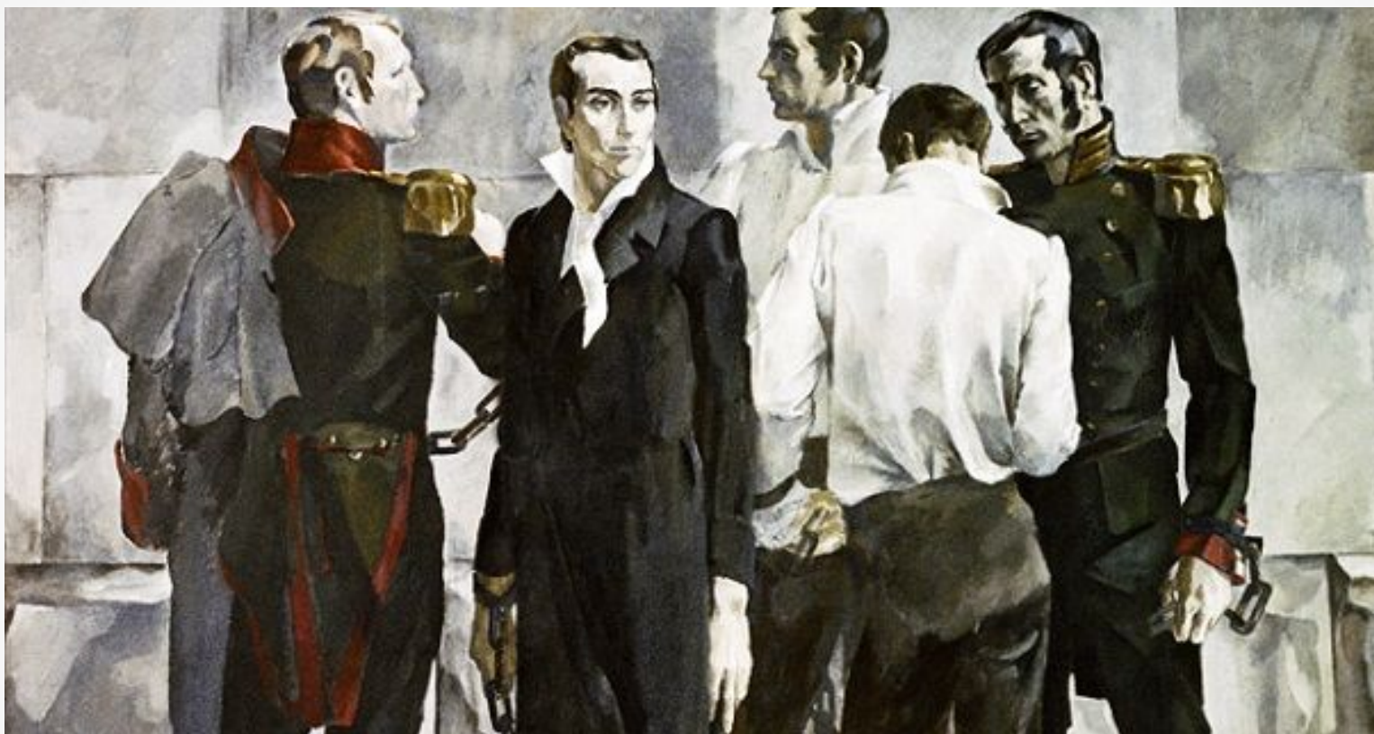
Декабристы в ссылке