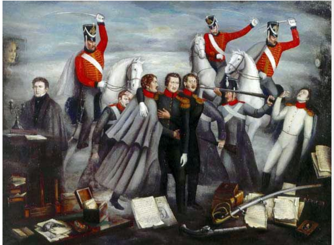
Декабристы. Восстание Черниговского полка.