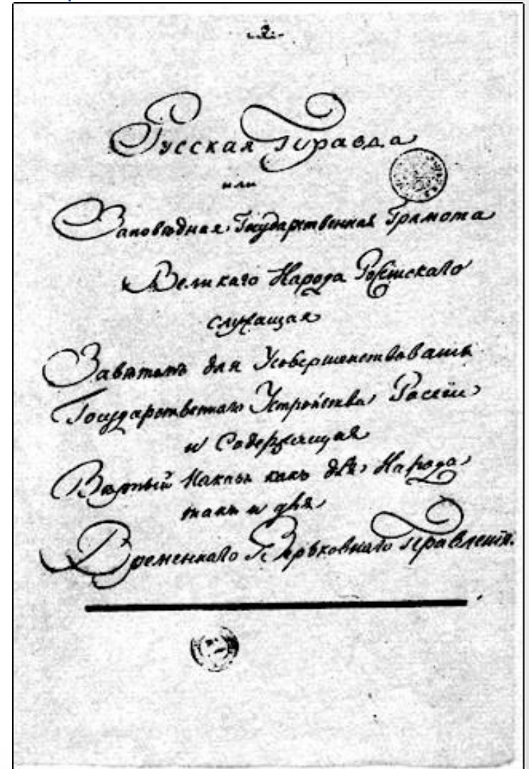
"Русская правда" П.И. Пестеля

Более революционное из них, Южное, возглавил П. Пестель. «Союз благоденствия» возобновил тайное общество под названием «Южное общество». Структура его была аналогичной структуре Союза спасения: в его составе – исключительно офицеры, строгая дисциплина. Предполагалось установить республиканский строй путём цареубийства и военного переворота.