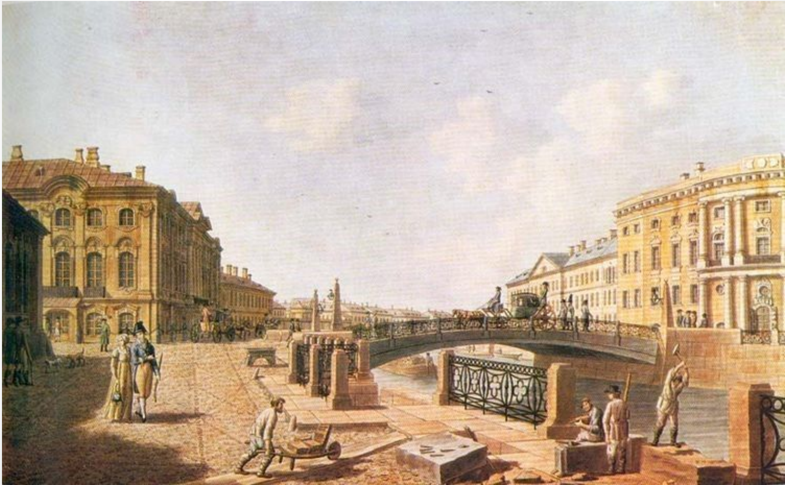
Дом декабриста Перетца в Санкт-Петербурге Невский проспект, 15, угловой дом справа. (Бывший дом князя Куракина).

— начало 1825 г. — создание Северного (Санкт-Петербург) и Южного (Украина) обществ декабристов. Во многом они были похожи, но в нескольких вопросах расходились.