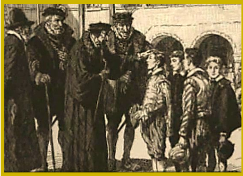
Жан Кальвин в Женеве.