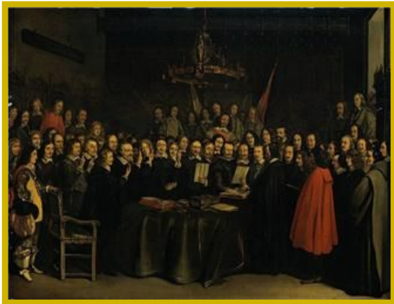
Аугсбургский религиозный мир.