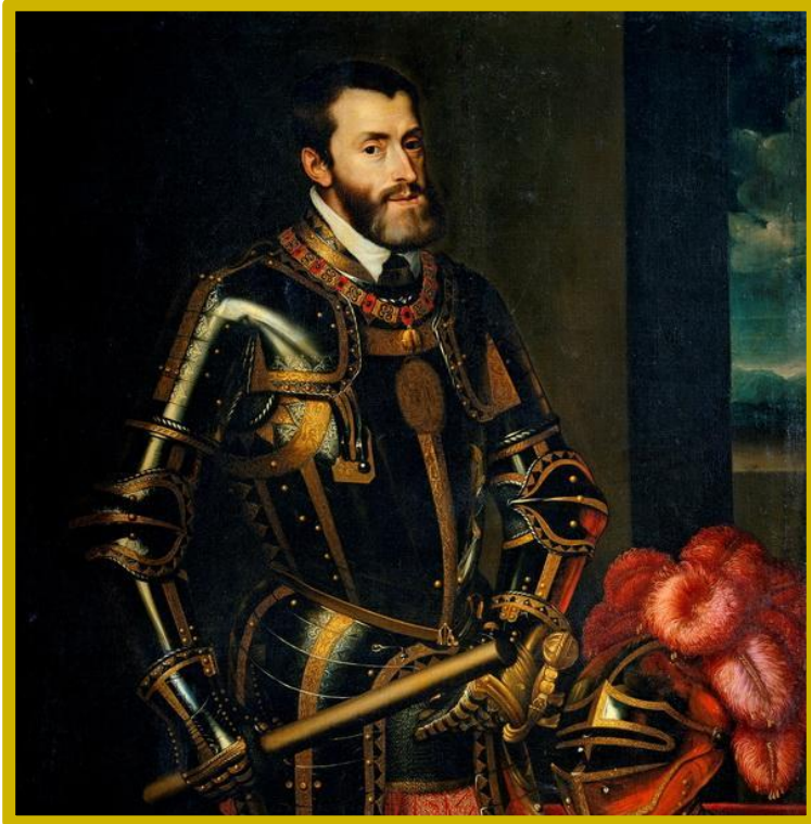
Император Карл V.