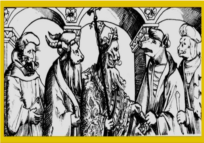
Папа Римский и богословы.