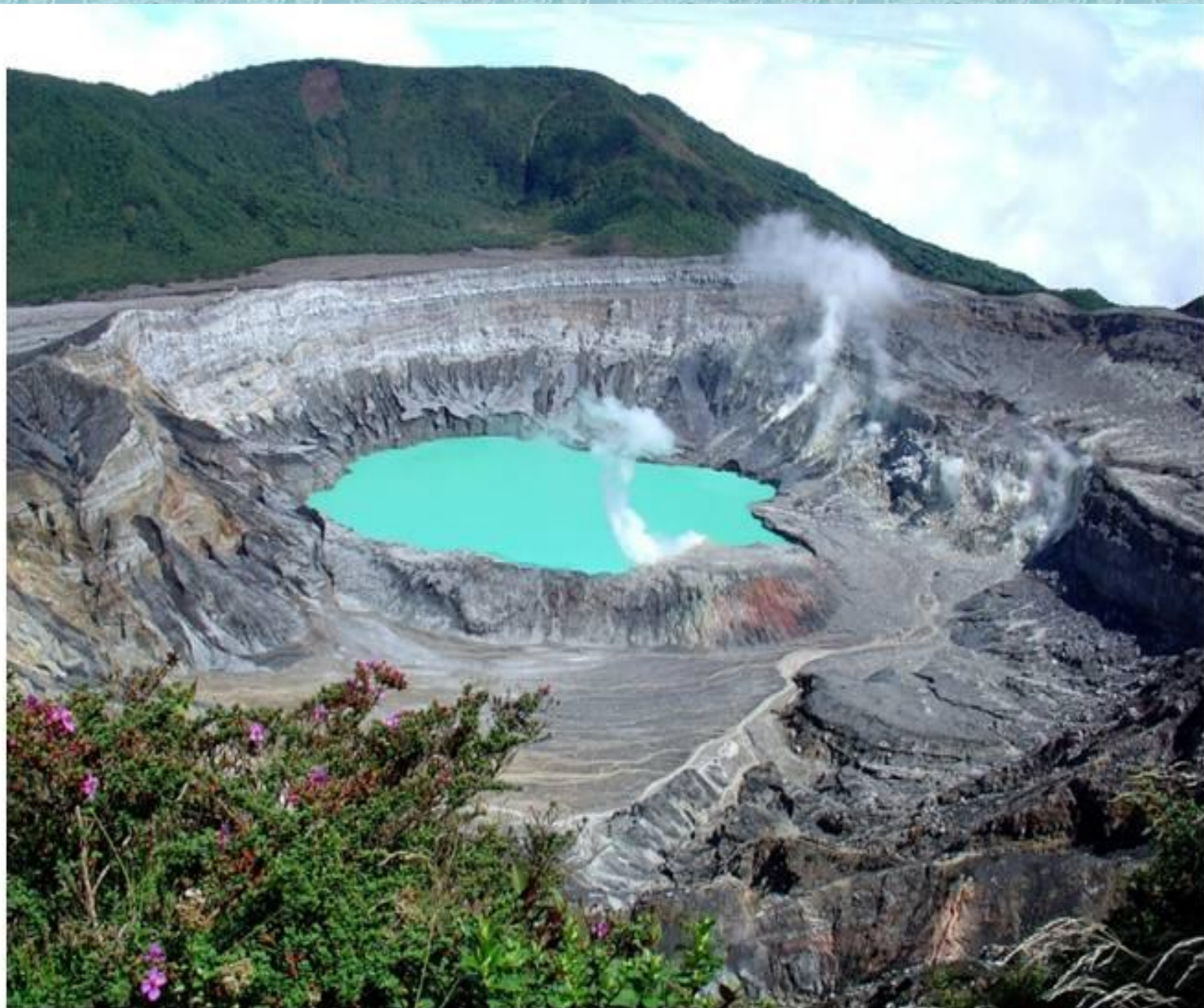
Кратер вулкана Poas, озеро в кратере вулкана.