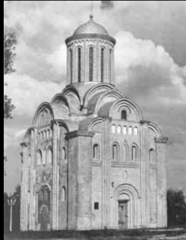
Чернигов. Пятницкая церковь XII века