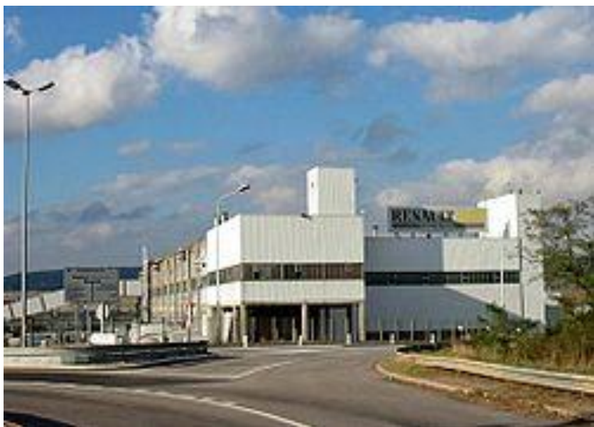
Завод «Renault» в городке Обергенвилль