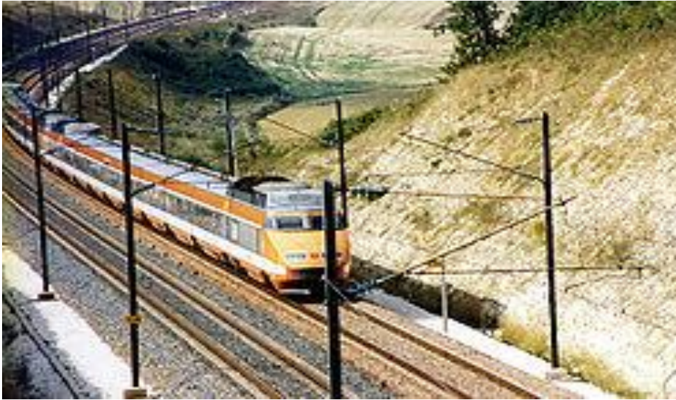
Поезд TGV PSE на линии Париж—Лион