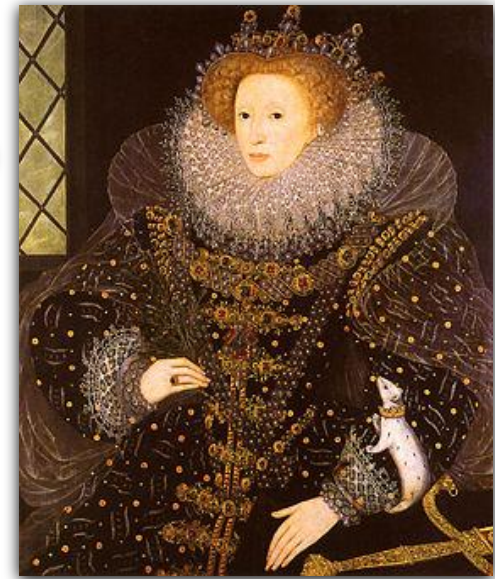
Елизавета I (дочь Генриха VIII и Анны Болейн)