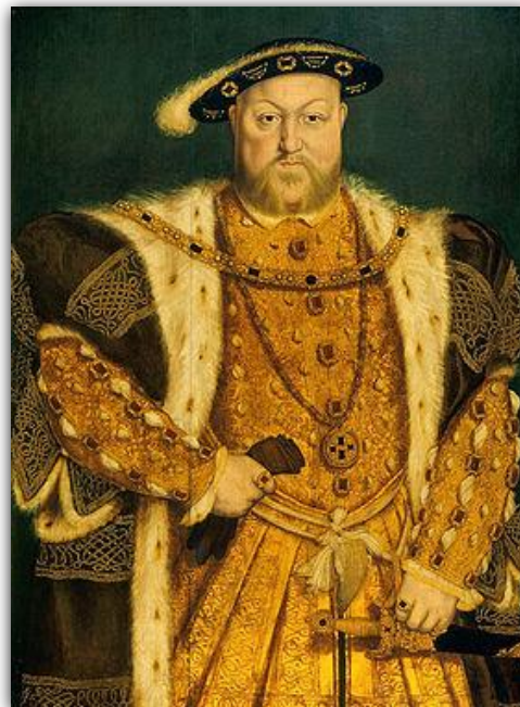
Генрих VIII Тюдор