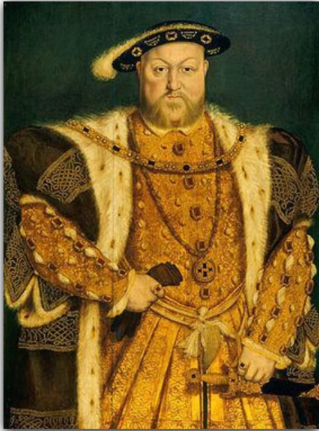
Генрих VIII Тюдор