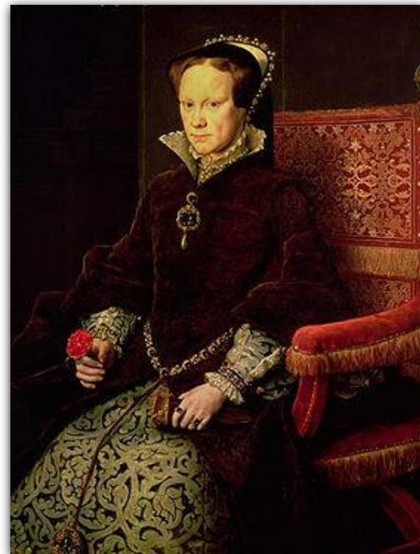
Мария Католическая, Кровавая (дочь Генриха VIII)