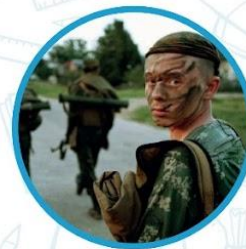
Юный спецназ Росгвардии