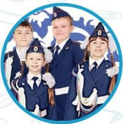
Юные инспектора движения