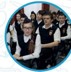
Юные помощники полиции